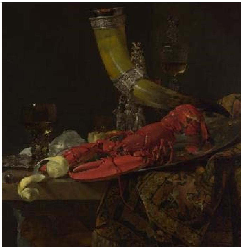
تصویر ۳: نقاشی طبیعت بی‌جان از ویلیام کالف (nationalgallery.org.uk/artists/willem-kalfplanetpompeii.com). Fig. 3: Still Life Painting by Willem Kalf (nationalgallery.org.uk/artists/willem-kalfplanetpompeii.com).

ابزاری برای بیان مسائل دینی فراهم کرد. یک شکل خاص از طبیعت بی‌جان نمادین (به‌نام «وانیتاس») به چیدمان اشیای نمادینی می‌پرداخت که برای یادآوری گذرا بودن زندگی روی زمین به بیننده طراحی شده بود. طبیعت بی‌جان به‌طور کلی و قطعات وانیتاس به‌طور خاص، به‌شدت موردتوجه طبقه متوسط هلندی پیوریتان بود، جامعه اروپا حتی در قرون وسطی نیز، موضعی سخت‌گیرانه‌تر از الهیات پروتستان را به نسبت هنر و حوزه زیباشناسی به خود ندیده است. اصرار به صرف رستگاری سرمدی و تمایز قاطعش بین ساحات زمینی و آسمانی، علاوه بر آن‌که هنرمندان را از حمایت کلیسای فاقد هرگونه منبع مالی محروم ساخته بود؛ اماکن دینی و کلیساها را نیز از هرگونه تصویر و تمثال تهی کرده بود. گردآوری اسطوره‌های پیش از مسیحیت و موضوعات مربوط به هنر و ادبیات کلاسیک حرام تلقی می‌شد. «گاردنر» در اثر ماندگارش «هنر در گذر زمان» پرسشی را مطرح می‌کند که پاسخش قطعاً یکی از عوامل اصلی تحولات به‌وجود آمده در هنر آن مقطع اروپا و به‌ویژه هلند محسوب می‌شود. «موضوعات مذهبی یا بعدها موضوعات کلاسیک و تاریخی در طی سده‌های میانه و دوره رنسانس، انگیزه‌های اصلی آفرینش هنری بودند. دنیای هنر که از این سرچشمه‌ها محروم شده بود، دیگر چه چیزی برای غنی کردن زندگی هلندی‌های ثروتمند در اختیار داشت؟» (گاردنر، ۱۳۸۱: ۵۲۳).