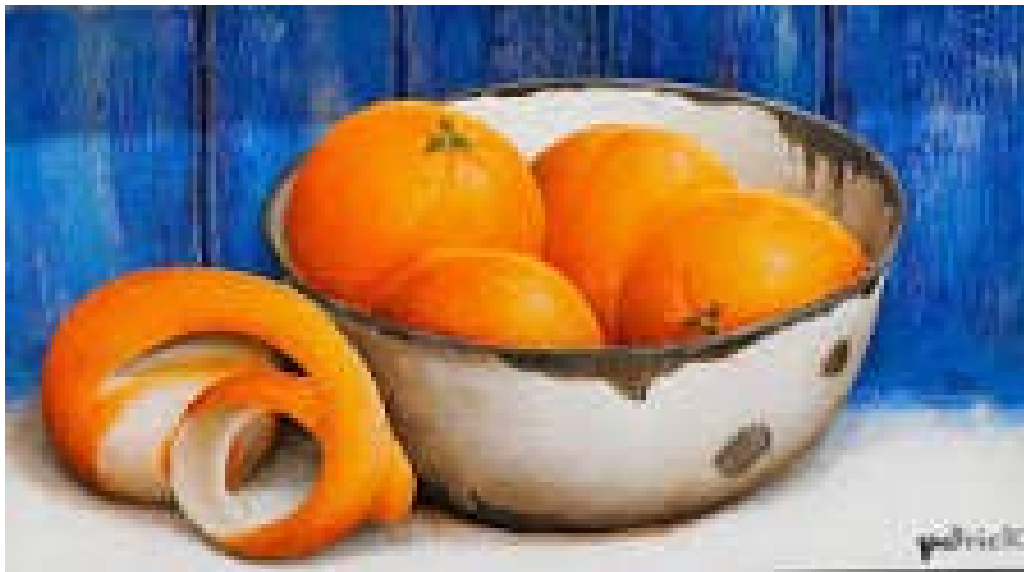
تصویر ۲: طبیعت بی‌جان از لئوناردو داوینچی ( https://www.davincigallery.co.za/product/still-lifepair ). Fig. 2: Still Life by Leonardo da Vinci ( https://www.davincigallery.co.za/product/still-lifepair ).

«در سده ۱۶م. نیز، غذاها و گل‌ها دوباره به‌عنوان نماد فصول و حواس پنج‌گانه ظاهر شدند؛ هم‌چنین سنت استفاده از جمجه در نقاشی‌ها (Omina mors aequa) به‌عنوان نمادی از مرگ و میر مورد توجه مجدد قرار گرفتند» (Ebert, 2012: 22)؛ البته می‌توان این آثار را که عمدتاً در ربع آخر سده ۱۶م. خلق شده‌اند، به مثابه زمینه ظهور آثار استادان کوچک هلندی دانست. «گرچه بیشتر آثار طبیعت بی‌جان در سده ۱۷م. تابلوهایی نسبتاً کوچکی هستند؛ اما مرحله مهمی به مرکزیت آنتروپ در اواخر سده ۱۶م. را نمی‌توان در توسعه و شکوفایی این سبک نادیده گرفت. تابلوهایی با ابعاد بزرگ که شامل گستره زیادی از عناصر طبیعی بود» (Vlieghe, 1999: 275).