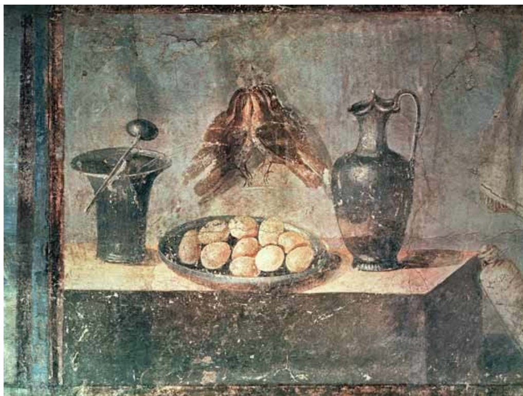
تصویر ۱: نقاشی طبیعت بی‌جان کشف شده در ویلایی در پمپئی

که طبقات مرفه از آن لذت می‌بردند، نشان می‌داد؛ هم‌چنین به‌عنوان نشانه‌هایی از مهمان‌نوازی و جشن‌های فصول و زندگی عمل می‌کرد (Schifferer, 1999: 19)؛ البته در نقاشی‌های یونان باستان و افسانه‌های «ژئوکسیس» ۲ و «پارهاسیوس» ۳ نیز، طبیعت بی‌جان و میزان واقع‌گرایی افسانه‌ای آن‌ها، قابل طرح و بررسی است. همان‌گونه که در «تاریخ طبیعی» مورد تأکید قرار می‌گیرد: «قرن‌ها قبل از روم و اوج نقاشی پرتره، یونانی‌ها در سبک طبیعت بی‌جان پیشرفت کرده بودند. بنابر ادعای پلینی، این نوع نقاشی «نقاشی موضوعات مبتذل» نامیده می‌شد» (Pliny, 1952: xxxv, 115).