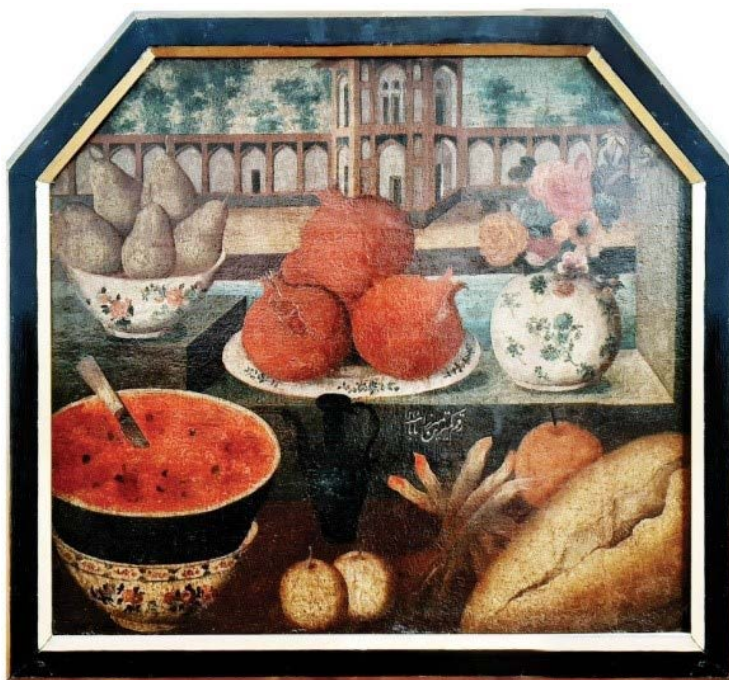
تصویر ۴: نقاشی طبیعت بی‌جان (شب یلدا) از میرزا بابای اصفهانی ( https://www.pinterest.com ). Fig. 4: Still Life Painting (Shab-e Yalda) by Mirza Baba-e of Isfahani ( https://www.pinterest.com ).

نخستین «نقاش باشی» دربار که برجسته‌ترین آن‌ها نیز بود، «میرزا بابای اصفهانی» است که نماینده تام و تمام «پیکرنگاری درباری» ۴ محسوب می‌شود. «شب یلدا»، هنوز عناصر ایرانی را دارد، موضوعش سنتی و کاملاً ایرانی است؛ سایه‌روشن، حجم‌پردازی و تاحدودی بازی نور در آن قابل مشاهده است؛ البته نمی‌توان آن را کاملاً برآیند روح و تفرد هنرمند به حساب آورد؛ چراکه ترکیب‌بندی عناصر تابلو، تابعی از سفره‌های شب یلدای آن دوران است، تا ذوق شخصی؛ و این آخرین تلاش‌های هنرمند ایرانی جهت حفظ سنت‌های ایرانی تا قبل از «کمال‌الملک» است (تصویر ۴).