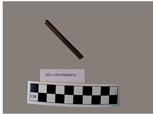
تصویر ۸. قلم نگارش (نگارندگان، ۱۳۹۹). Fig. 8. Writing pen (Authors, 2020).