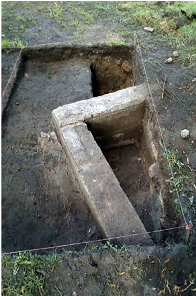
تصویر ۶ الف. عکس هوایی وضعیت فعلی محوطه اردوگاه، بخش‌های سفیدرنگ کارگاه‌های کاوش؛ ب. عمق پی بتنی کلبه اول (دنیل شفر).