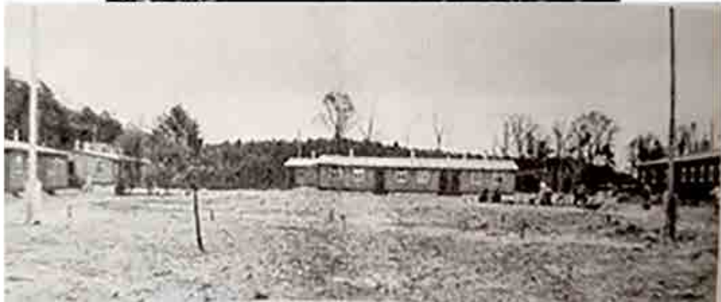
تصویر ۲. اردوگاه‌های کار اجباری، بالا، اردوگاه فهربلین عکس در سال ۱۹۳۸ م. پایین، اردوگاه کار وُسترا (Pagenstecher, 2004 b: 108).