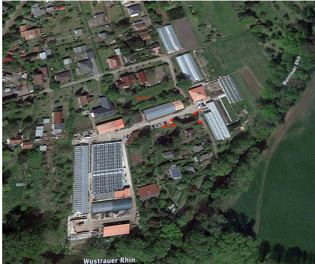
تصویر ۵. نشانه‌های قرمز کارگاه‌های کاوش سال ۲۰۲۰ م. (نگارندگان، ۱۴۰۰).

کاوش با مجوز اداره باستان‌شناسی و ابنیه ایالت برندنبورگ، با تمرکز کاوش بر کلبه‌های اردوگاه به‌ویژه کلبه اسرای معروف به «کلبه کارکرد اداری» و «کلبه بهداشتی» انجام گرفت. در فصل نخست کاوش از ۸ کارگاه کاوش، ۵ کارگاه ۱، ۲، ۶، ۷ و ۸ یافته‌های مادی، مرتبط به اردوگاه آموزش اجباری مسلمانان تاتار و نیز دوره متأخرتر به دست آمد (تصویر ۵).