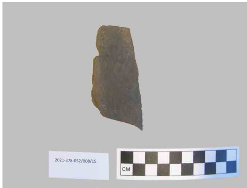
تصویر ۹. لوح نگارشی (نگارندگان، ۱۳۹۹). Fig. 9. Writing tablet (Authors, 2020).

مستندات تاریخی بیانگر آموزش روزانه شش ساعته در اردوگاه است، به این زمان بحث‌های تکمیلی و بررسی اوضاع اجتماعی روز نیز باید اضافه شود. در راستای تعلیم به منظور یادگیری اصول نازی، آن‌ها را برای بازدید به شهرهای مختلف آلمان نیز می‌بردند. سفرها و بازدیدها متنوع و برای دیدن بناهای قدیمی و جدید فرهنگی، کارخانه‌ها، سینما و غیره برنامه‌ریزی شده بود (Bundesarchiv, 1944, R6/592: 16-18). براساس یافته‌های به دست آمده از کاوش، به ویژه از کارگاه ۲، قلم نگارش (تصویر ۸) و تخته‌های سنگی سیاه شکسته که کاربرد نگارش متن و آموزش ریاضی است، به وضوح بخش آموزش و تعلیم را در این کارگاه تأیید می‌کند. بر روی یکی از الواح سنگی باریک، چهار ردیف خط منظم جهت نگارش و تعلیم خط (ادبیات و غیره) کشیده شده است. بر روی قسمت پشت این تخته سیاه، بخش بندی شده است و برای عملیات حسابرسی و آموزش حساب مورد استفاده قرار می‌گرفته است. این یافته به خوبی متون مکتوب تاریخی جهت تعلیم اجباری اسرا در نظام نازی‌ها را تأیید می‌کند (تصویر ۹).