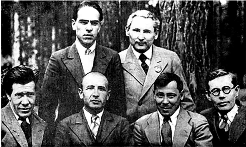
تصویر ۱۱. موسی جلیل و همکاران نویسنده‌اش، ۱۹۴۰؛ پایین، نفر دوم از راست (Gimadeev & Plamper, 2007: 101).