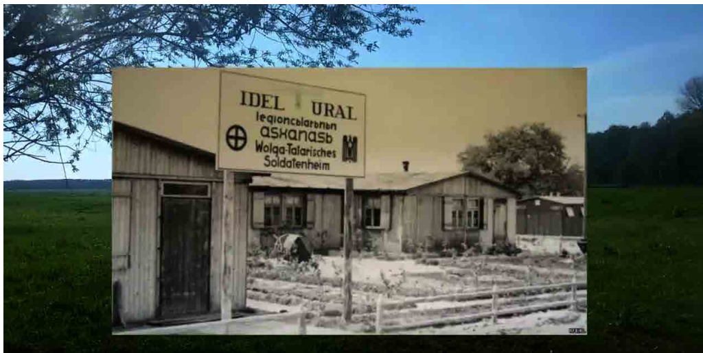
تصویر ۱. عکس بایگانی از اردوگاه گردان ایدل-اورال تاتار.

در محدوده جغرافیایی مورد مطالعه، هرچند بخشی از پرونده‌هایی که اطلاعات اردوگاه‌های کار اجباری در زمان اتمام جنگ و بعد از آن از بین برده شد، وجود اردوگاه‌های کار اجباری گروه‌های مختلف انسانی، مانند بازداشت‌شدگان آلمانی توسط «گشتاپو» در برلین و همچنین اسرای جنگ جهانی دوم در این استان گزارش شده است؛ بخشی از این اسرا و زندانیان در شرکت‌های آلمانی همکار رژیم نازی مانند «باست‌فازر» (Bastfaser) به بیگاری بی‌رحمانه‌ای گماشته شده بودند (Pagenstecher, 2004 B: 71-75; Pagenstecher, 2004 C: 108). با گشوده شدن جبهه جدید توسط آلمان‌ها در شرق، اسرای ارتش سرخ شوروی به این منطقه منتقل شدند. در سال ۱۹۴۲ م.، اردوگاه اسرای وُسترا در حاشیه جنوب شرقی روستا، تعداد ۱۵۰۰ اسیرجنگی با قومیت‌های مختلف که بخشی از آن‌ها از گروه‌های مسلمان تاتارهای معروف به «ولگاتاتار» از منطقه قفقاز بودند، نگهداری و تعلیم داده می‌شدند تا بعدها در گردان مشخص منطقه ایدل-اورال به خدمت گرفته شوند (Theilig, 2019: 25; Kuhlmann-Smirnov: 2004: 42; Bundesarchiv, 1944). (تصویر ۱).