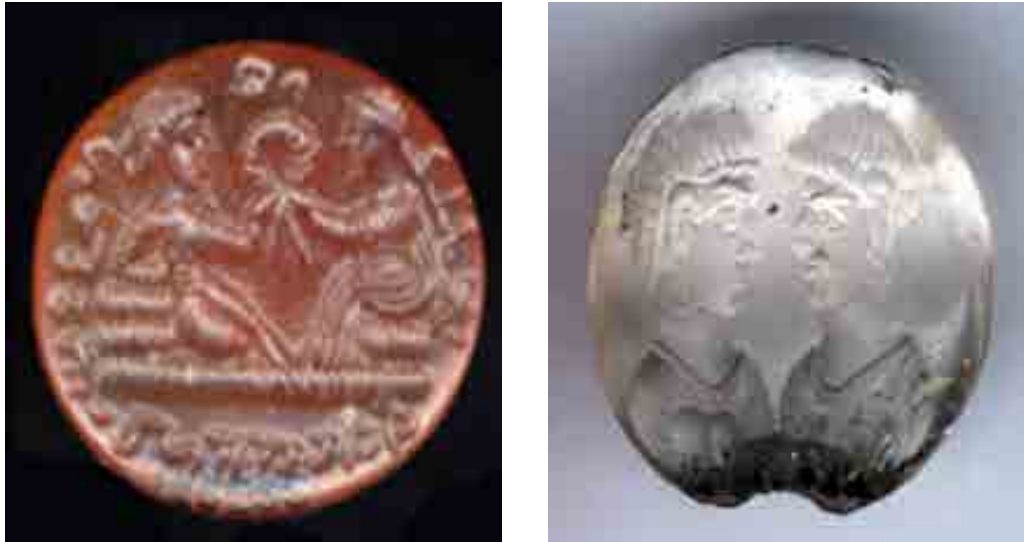
تصویر ۳: تصویر ملکه در کنار پادشاه در مهری ساسانی (https://www.britishmuseum.org/collection/object/A_1880-3501&1533164001)