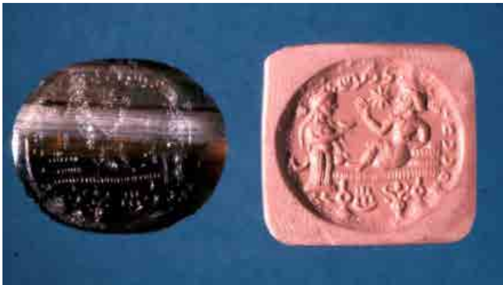
تصویر ۴: نقش زن و مرد بر مهر ساسانی با مفهوم ازدواج (https://www.britishmuseum.org/collection/image/425635001).