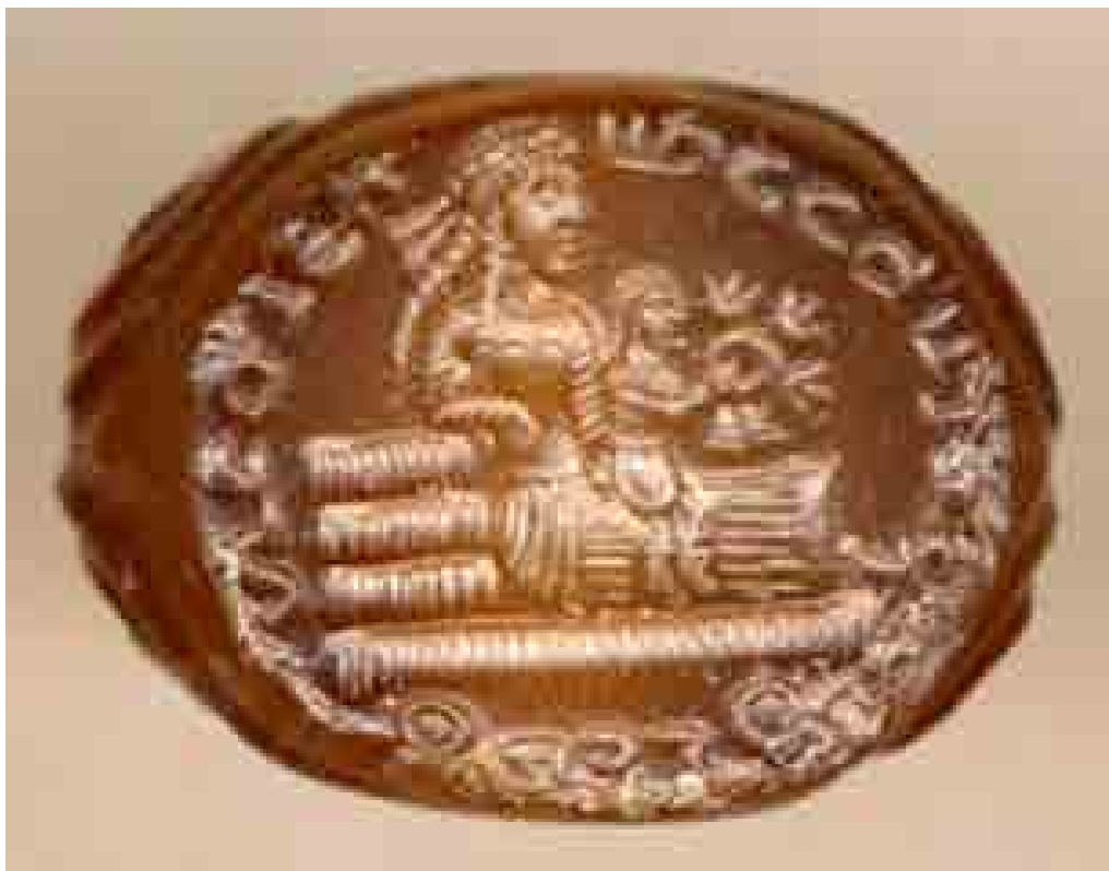
تصویر ۵: نقش زن و کودک بر مهری ساسانی ( https://www.britishmuseum.org/collection/object/A_1880-3503_1 ). Fig. 5: The motif of woman and child on Sassanid Mehri ( https://www.britishmuseum.org/collection/object/A_1880-3503_1 ).