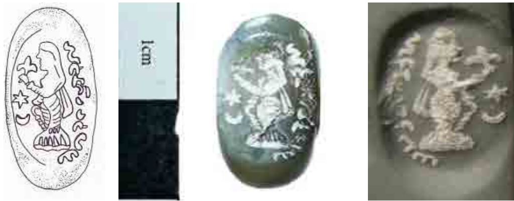
تصویر ۶: مهر موزه آرامگاه بوعلی سینا با نقش زن، همدان. Fig. 6: Bu-Ali Sina Museum seal with a woman motif.

نسبت است (46: 1979: Gignoux). با توجه به نظریه فرای و گوبل و با تمرکز بر خط فارسی میانه و ریخت‌شناسی مهرها (46: 1973: Frye؛ گوبل، ۱۳۸۴: ۳۶)، می‌توان تاریخ این مهر را متعلق به اواخر دوره ساسانی دانست.