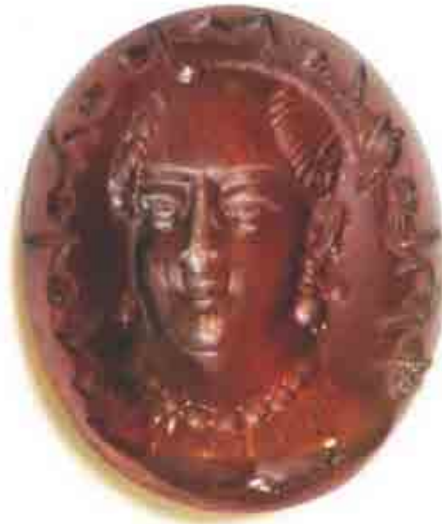
تصویر ۱: مهر ساسانی با نقش مایه زن با ویژگی‌های مردانه ( https://www.britishmuseum.org/collection/image/611637001 ). Fig. 1: Sassanid seal, female figure with male characteristics ( https://www.britishmuseum.org/collection/image/611637001 ).