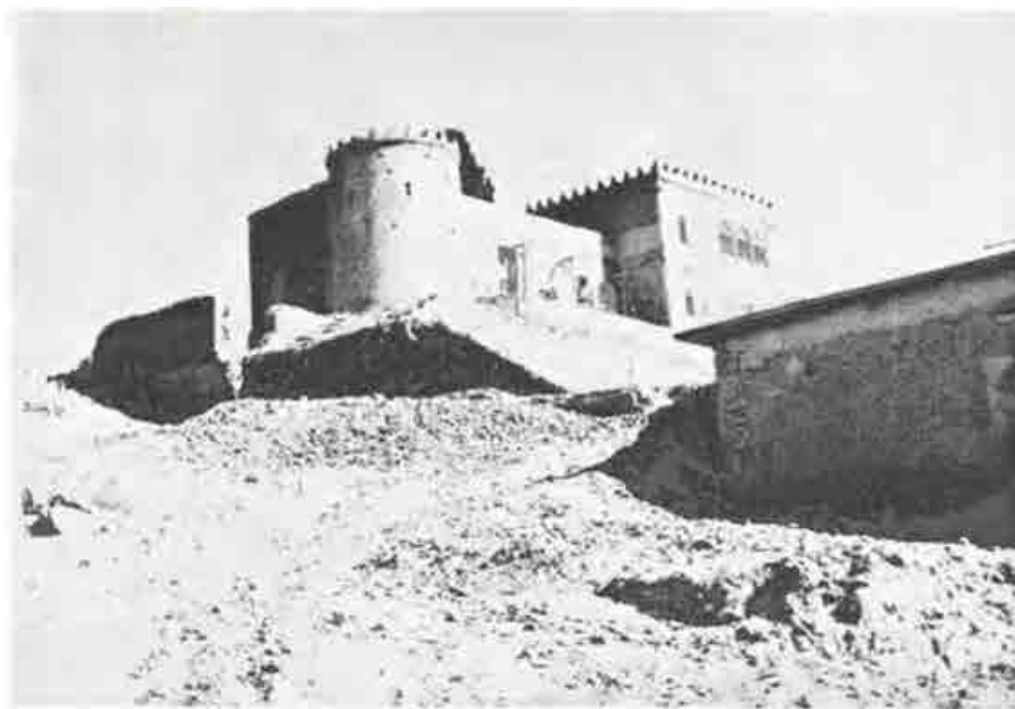
تصویر ۱: قلعه آقامحمدخانی احداث شده در باغ تخت شیراز از نمای جنوب غربی (اسلامی، ۱۳۵۰: ۵۹).