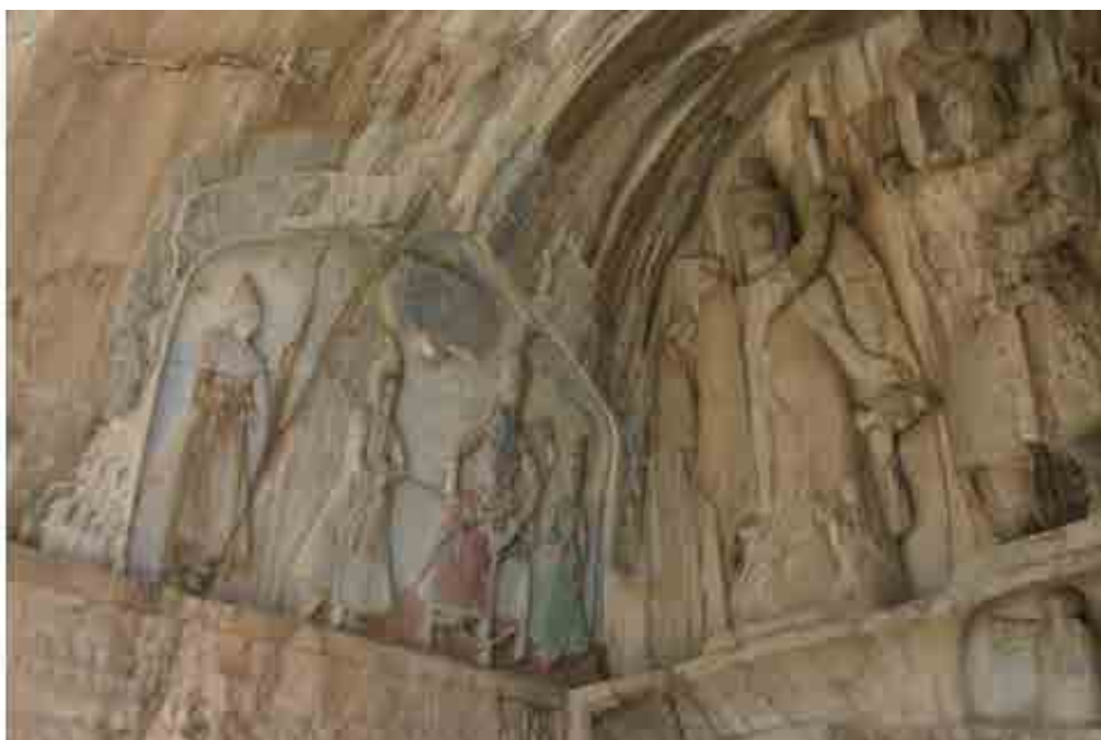
تصویر ۲: نقش برجسته جلوس فتحعلی شاه قاجار که به نقش برجسته عصر ساسانی طاق بستان اضافه شده است (Grigor, 2007).