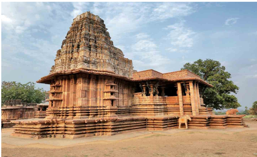
تصویر ۲: «معبد رامپا» ۳۵ نمونه آثار درجه یک کشور هند (سازمان باستان‌شناسی هند، ۲۰۱۹).

- درجه سه: شامل ساختمان‌های مهم برای منظر شهری که ویژگی‌های معماری، زیبایی‌شناختی یا جامعه‌شناختی را برمی‌انگیزد؛ هرچند نه به اندازه درجه دو. این آثار به تعیین ویژگی‌های خاص در نماها و یکسان بودن ارتفاع، عرض و مقیاس کمک می‌کنند (Karnataka Town & Country Planning Act, 1961).