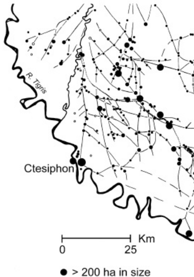
تصویر ۳. تمرکز مراکز شهری و ارتباط آن‌ها در اطراف تیسفون (Smith, 2005: 842).

حفظ و کنترل قلمرو توسط سرمایه‌گذاری‌های مختلفی، مانند ساخت سازه‌های دفاعی صورت می‌گرفت که دفاع از مرزها و امنیت شبکه راه‌ها و نظارت بر جابه‌جایی مردم را برقرار می‌ساخت و بدین ترتیب، ساسانیان منابع مهم نیروی انسانی و کشاورزی را کنترل می‌کردند (Smith, 2005: 841). تلاش‌های ساسانیان برای تمرکز بخشیدن به قدرت و دسترسی هرچه سریع‌تر به مناطق مختلف امپراتوری همچنان در سده‌های پنجم و ششم میلادی نیز ادامه دارد. پیروز شاهنشاه ساسانی که بیشتر سال‌های پادشاهی خود را صرف آرام ساختن مرزهای کشور به خصوص در شرق و نبرد با هپتالیان کرد، شهرها و استحکاماتی را برای حفاظت از مرزهای شرقی برآورد؛ از جمله نزدیک گرگان شهری ساخت با نام «روشن فیروز» (ثعالبی، ۱۳۶۸: ۳۷۵). او در ناحیه جنوبی دریای خزر و ری کنونی احتمالاً برای کنترل بیشتر بر مناطق دیلمی، شهری با نام «رام فیروز» ساخت (ثعالبی، ۱۳۶۸: ۳۷۱). در شمال بغداد نیز به منظور حفاظت بیشتر از پایتخت، شهر کرخ فیروز و بناهای مستحکم برآورد (Christensen, 2016: 69). همچنین برای امنیت بخشیدن به مرزهای شمالی در کرانه غربی دریای کاسپین و در ناحیه آذربایجان شهری با نام «شهرام پیروز» پی افکند (ثعالبی، ۱۳۶۸: ۳۷۱).