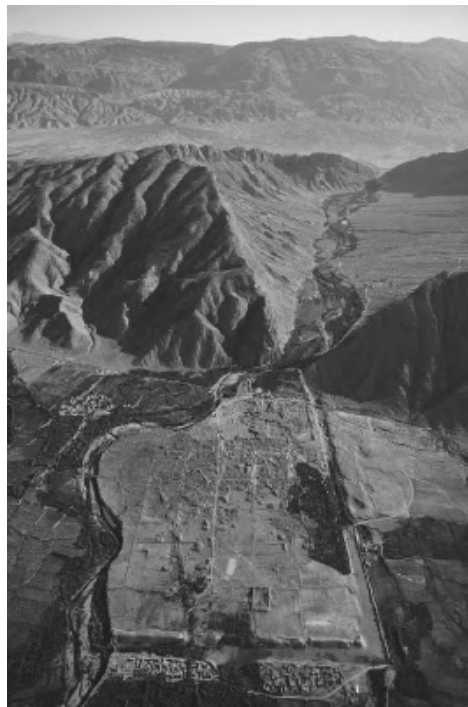
تصویر ۲. موقعیت شهر بیشاپور (Brosius, 2006: 171).

که از راه دروازه‌های پارس به خوزستان می‌رسید، شرکت داشتند (برونر، ۱۳۹۳: ۱۵۴). همچنین آن‌ها پلی را روی رودخانه شوشتر مهندسی کردند (یعقوبی، ج. ۱، ۱۳۸۲: ۱۹۵). افزون بر مسیرهای ذکر شده، بیشاپور در میان راه دو شهر بزرگ دوره ساسانی، یعنی اردشیرخوره و شوش قرارداداشت و جاده‌ای دیگر آن را به شیراز متصل می‌کرد (گروسی، ۱۳۸۸: ۱۸)، (تصویر ۲)؛ با توجه به مطالب گفته شده، می‌توان «شاهنشاهی ساسانی» را به عنوان یک «امپراتوری شبکه‌ای» در نظر گرفت. در مدل امپراتوری شبکه‌ای، سرزمین‌ها از یک شبکه راهرویی تشکیل شده‌اند که گره‌های جذاب منابع یا همان شهرها را به هم پیوند می‌دهند (Smith, 2007: 29). آن چه در پی می‌آید، شواهد بیشتری را در این مورد آشکار می‌سازد.