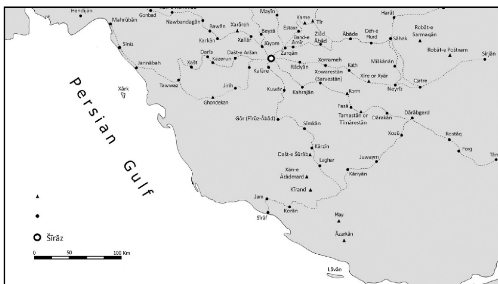
تصویر ۴. موقعیت شهرها و شبکه شهری ایالت فارس (Miri, 2012: 131).

سرعت پیشروی مهاجمان را دو چندان کرد؛ زیرا آن‌ها علاوه بر شناسایی مناطق و پادگان‌های مهم از نظر نظامی، به مسیرها و اوضاع شهرها به خوبی آشنا بوده‌اند و راهنمای خوبی برای اعراب به منظور استفاده حداکثری از شرایط و غنائم جنگی بودند (موحد، ۱۳۹۸: ۸۷). استان «دارابگرد» نیز دارای دو شهر عمده به نام‌های «دارابگرد» و «فسا» بود (ابن حوقل، ۱۳۶۶: ۳۴). حدود این استان ظاهراً تا سواحل کرمان می‌رسید (برونر، ۱۳۹۳: ۱۵۳)؛ بنابراین، اعراب توانستند با تصرف آنجا به راحتی تا کرمان پیش‌روی نمایند. این درحالی بود که پس از فتح جبال و فارس مسیرهای تدارکاتی کرمان از غرب و شمال مسدود گردید و کویر لوت در شرق، رساندن تدارکات را با دشواری مواجه می‌ساخت.