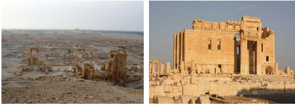
تصویر ۱. تصاویر بعد از تخریب معبد بعل پالمیرا (Rehfeld, 2009).