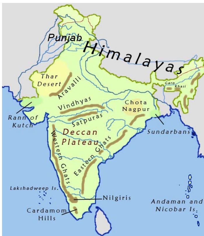
تصویر ۱. شبه جزیره دکن (تارنمای سازمان جغرافیای ارتش ج.ا.ا.).

شبه جزیره دکن (تصویر ۱) که به شکل مثلث در ساحل اقیانوس آرام در جنوب هند قرار دارد و در شمال آن، دو جلگه حاصل خیز سند و گنگ جای دارند (شاملویی، ۱۳۷۰: ۵۷). هم‌زمان با سلطنت صفوی، سلاطین بهمنی در این شبه جزیره حکومت داشتند. تشیع در قرن نهم و دهم هجری قمری، توسط برخی خاندان‌های حکومتگر مسلمان به عنوان مذهب رسمی دکن برگزیده شدند. این سلسله‌ها از بهمنیان (۹۳۲-۷۴۸ ه.ق.) که اولین حکومت مستقل مسلمان در جنوب هند بودند، منشعب شدند. در دوره صفویان، مذهب تشیع در شبه جزیره دکن توسعه پیدا کرد و بعضی از حکام آن منطقه، به سبب اشتراک مذهب، با دربار صفویه مناسبات قوی ایجاد کردند؛ نظام‌شاهیان، یکی از پنج حکومت سرزمین دکن بودند که شاه‌طاهر اسماعیلی در تمایل آن‌ها به مذهب تشیع نقش مهمی ایفا نمود (غفاری فرد، ۱۳۷۳: ۱)، چراکه با تلاش و سعی شاه‌طاهر، برهان نظام‌شاه نام خلفای سه‌گانه را از خطبه انداخت و پرچم و علم سبز را انتخاب کرد «و چون شاه‌اسماعیل صفوی از این تصمیم او مطلع شد، آقاسلمان مشهور به مهتر جمال را که چراغچی مقرب بود، جهت مبارک‌باد مذهب شیعه به احمدنگر فرستاد و همراه او یک غلام ترک به نام شاه‌قلی، یک عدد الماس قیمتی برای همایون شاه، یک قطعه زمرد و هدایای نفیس دیگر برای برهان نظام‌شاه فرستاد و یک انگشتر عقیق که سال‌ها خود در انگشت داشت و کلمه التوفیق من‌الله بر روی آن نقش شده بود را نیز برای شاه‌طاهر فرستاد» (منشی، ۱۳۸۲: ۸۶۵).