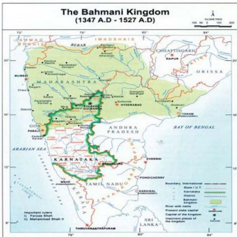
تصویر ۲. بعد از انقراض حکومت بهمنیان (دانشنامه بزرگ اسلامی).

بعد از انقراض حکومت بهمنیان (تصویر ۲) در منطقه دکن، پنج حکومت محلی از جمله: قطب‌شاهیان (گلکنده)، عادل‌شاهیان (بیجاپور)، نظام‌شاهیان (احمدنگر)، بریدشاهیان (بیدر) و عمادشاهیان (برآر) جانشین حکومت بهمنیان در این منطقه شدند. از میان این پنج حکومت، قطب‌شاهیان، نظام‌شاهیان و عادل‌شاهیان مذهب شیعه را در قلمرو تحت حاکمیت خود رسمیت بخشیدند و از شیعیان حمایت کردند که در تاریخ اسلام به عنوان حکومت‌های شیعه مذهب از آنان یاد می‌شود. عواملی وجود دارد که افرادی در گسترش مذهب تشیع در میان سلاطین این حکومت‌ها نقش داشتند که این امر منجر به تحکیم رابطه سیاسی دو کشور شده و حتی منجر به مهاجرت افرادی بین دو دولت شده است. از جمله این حکومت‌های محلی، نظام‌شاهیان بودند که ارتباط بسیار خوبی با دولت صفویه برقرار کردند. در رسمی شدن مذهب تشیع در حکومت نظام‌شاهیان عوامل زیادی وجود دارد. از جمله نقش دیوانسالاران، تجار و روحانیون و... و یا حتی نقش سیاسی