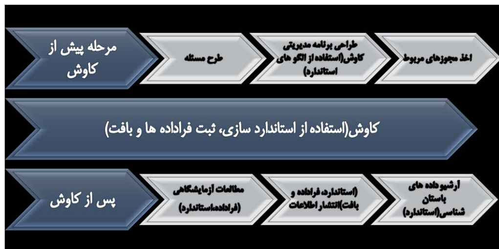
مدل ۲. ارتباط مؤلفه‌های اصلی در استفاده مجدد از داده‌ها (نگارندگان، ۱۳۹۸).