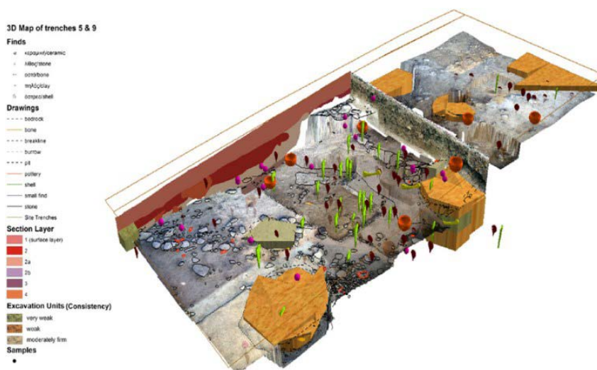
تصویر ۲. ترکیبی از قسمت‌های مختلف بافت یک کارگاه شامل واحدهای کاوش، مواد باستانی، نقشه‌ها و عکس‌ها (Katsianis et al., 2008).