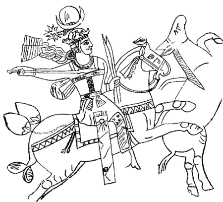
تصویر ۱۰. طرح بشقاب ساسانی (بهرامی، ۱۳۲۳: ۳۵).