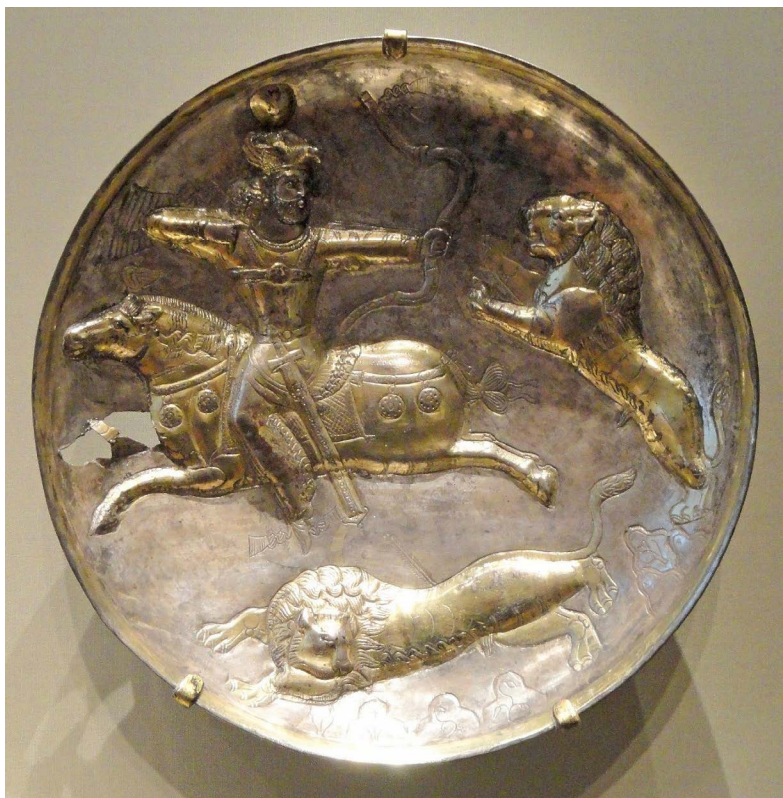
تصویر ۲. بشقاب ساسانی با نقش شاه ساسانی (هرمزد دوم) در حال شکار شیر (موزه هنر کلیولند).