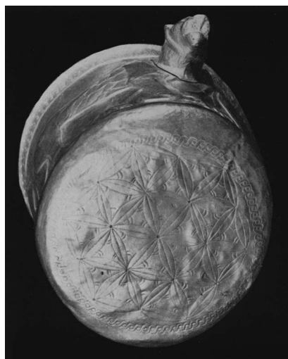
تصاویر ۷-۹. از راست: جام زرین کلاردشت و طرح آن (پرادا، ۱۳۷۳: شکل ۶۱)، قطر دهانه ۱۲ سانتی‌متر، قطر کف ۱۰/۷ سانتی‌متر، ارتفاع ۱۰ سانتی‌متر؛ تصویر پایین: کف جام زرین کلاردشت با نقوش هندسی (Samadi, 1959A: 16; 1959B: 180)