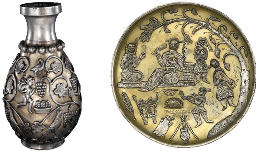
تصاویر ۱۳ و ۱۴. از راست: بشقاب و تنگ نقره‌ای ساسانی، به دست آمده از کشفیات اتفاقی در مازندران (Dalton, 1964: pl. XXVI).