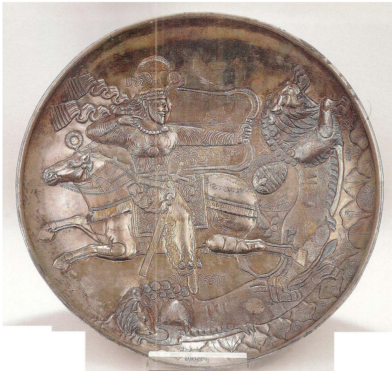
تصویر ۱. بشقاب نقره‌ای با نقش شاه یا شاهزاده ساسانی در حال شکار شیر، مکشوف از ساری، قطر ۶/۲۸ سانتی‌متر، وزن ۱۳۰۲ گرم. محل نگهداری: موزه ملی ایران، شماره ثبت ۱۲۷۵ (برگرفته از کاتالوگ آثار زرین و سیمین موزه ملی ایران).