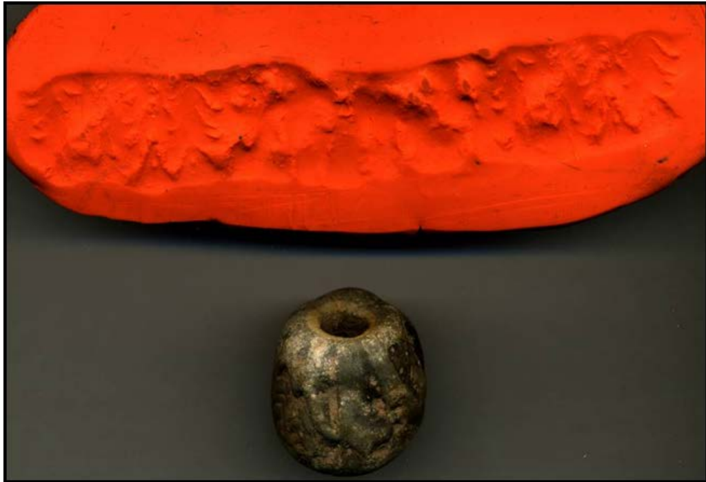
تصویر ۵. مَهر استوانه‌ای منتشر نشده به دست آمده از کارگاه D، اتاق شماره ۲ (آرشیو موزه ملی).