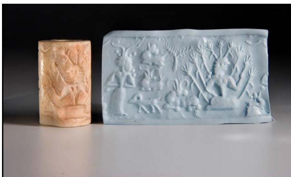
تصویر ۴. مهر استوانه‌ای به دست آمده از گور ۱۶۳ گورستان شهداد.