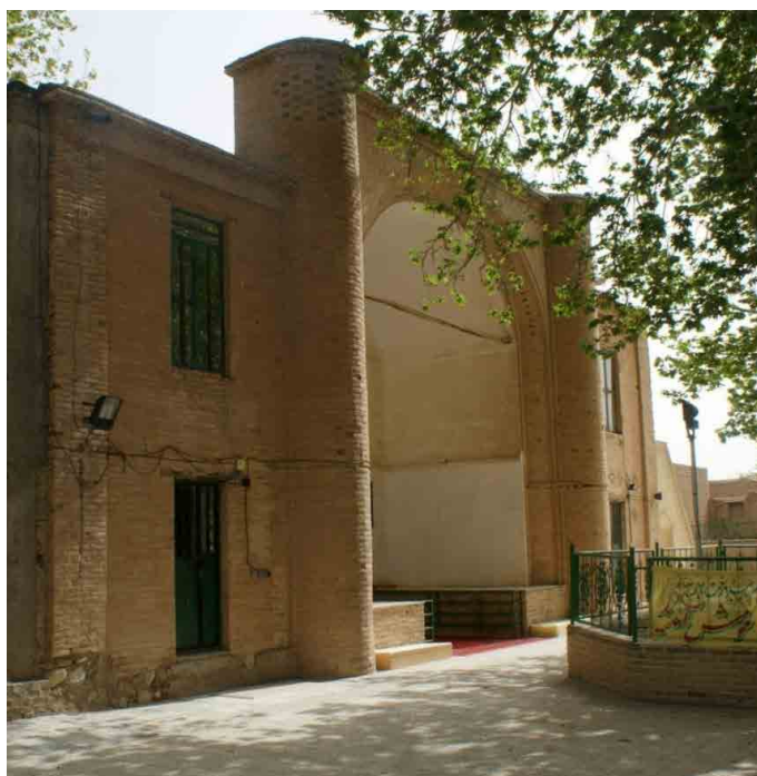
تصویر ۶. نمای ایوان ورودی امامزاده حمزه (خانی‌پور، ۱۳۹۴).