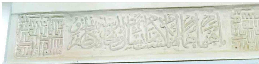
تصویر ۷. کتیبه‌ای که در آن سال ساخت بنای امامزاده به تاریخ ۹۵۳ ذکر شده (خانی‌پور و همکاران، ۱۴۰۰: تصویر ۱۱).