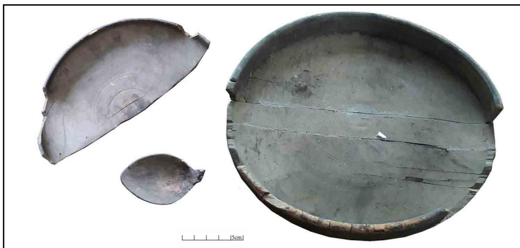
تصویر ۱۲. ظروف چوبی به دست آمده از غار کان‌گوهر (خانی‌پور، ۱۳۹۴).