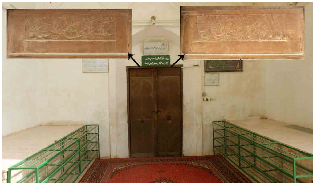
تصویر ۱۰. در ورودی امامزاده حمزه (خانی‌پور، ۱۳۹۴).

- در ورودی امامزاده حمزه: همان‌طور که گفته شد ورودی امامزاده از سمت ایوان جنوبی بنا است که در چوبی در ورودی قرار دارد. در فوق به صورت دو لنگه بوده که در بالای هر دو لنگه کتیبه و در وسط هرکدام کوبه‌ای فلزی قرار دارد که در نهایت با کلون فلزی در بسته می‌شود. سطح بیرونی با خطوط مورب لوزی مانند سرترنج کنگره‌داری در بالای هر لنگه تزئین شده است. بر روی لنگه سمت راست کتیبه «لا اله الا الله محمد رسول الله» و بر روی لنگه سمت چپ «علیا ولی الله حقا حقا» با خط ثلث نگاشته شده است. به نظر می‌رسد دو قاب نیز در پایین در وجود داشته که از بین رفته است. چارچوب نیز با گره چینی تزئین شده است (تصویر ۱۰).