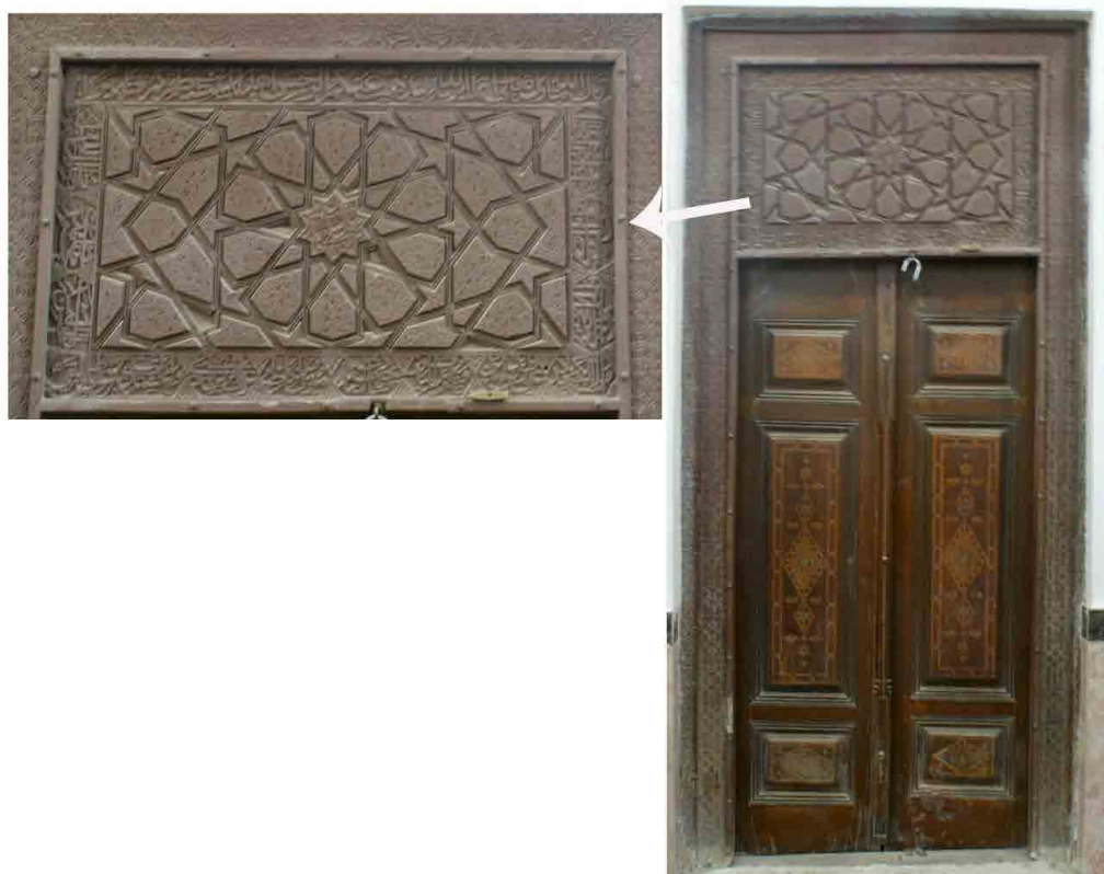
تصویر ۱۱. در چوبی امامزاده حمزه بزم (خانی‌پور، ۱۳۹۴).