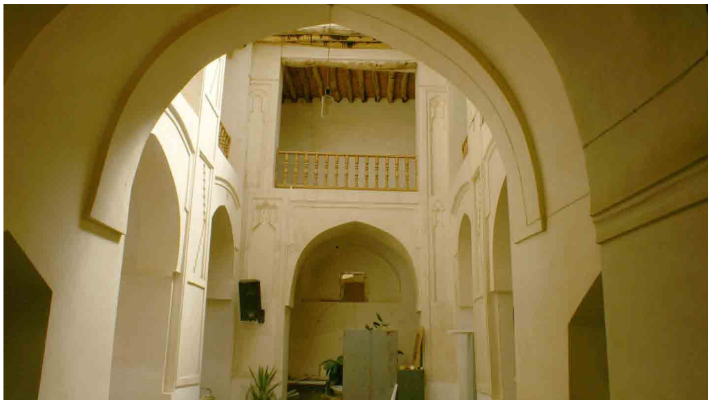
تصویر ۲. حیاط مرکزی با رواق‌های اطراف مسجد جامع (خانی‌پور، ۱۳۹۴). Fig. 2. Central courtyard with porticoes around the Grand Mosque (Khanipour, 2015).

وارد منبت‌کاری شد و در دوره‌های بعد تکمیل گردید و به صورت گل شاه‌عباسی درآمد. این اثر با طرح‌های بدیع، نقوش متنوع، گره‌چینی دقیق و کتیبه‌های کنده‌کاری و با تزئینات انواع خط ثلث بی‌نظیر، اطلاعات ارزشمندی از هنرهای چوبی و اعتقادات مذهبی از دوره خود در اختیار ما قرار می‌دهند (دهقانی و سامانیان، ۱۳۹۴).