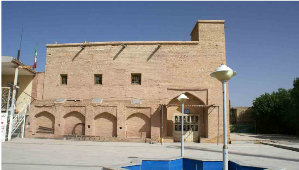
تصویر ۱. نمای شرقی مسجد جامع (خانی‌پور، ۱۳۹۴). Fig. 1. Eastern view of Jame Mosque (Khanipour, 2015).