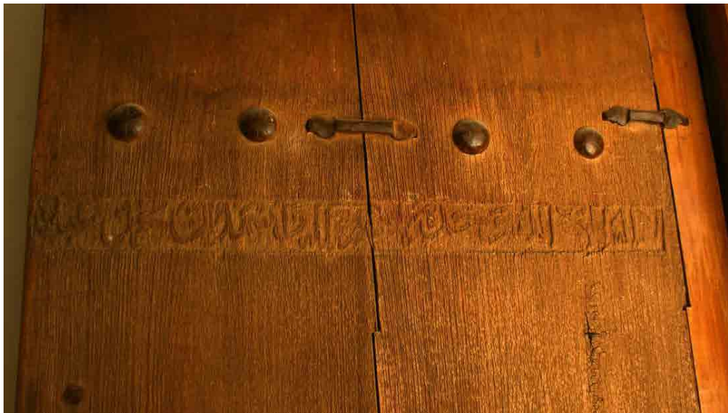
تصویر ۵. کتیبه درب سمت راست با متن شهادتین (خانی‌پور، ۱۳۹۴).