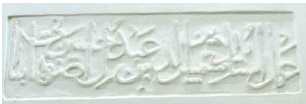
تصویر ۸. کتیبه‌ای که در آن نام استاد سازنده بنا نوشته شده (خانی‌پور، ۱۳۹۴).