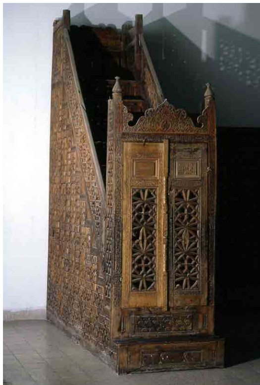
تصویر ۳. منبر چوبی مسجد جامع با تاریخ ۷۷۱ ه.ق. (خانی‌پور، ۱۳۹۴).