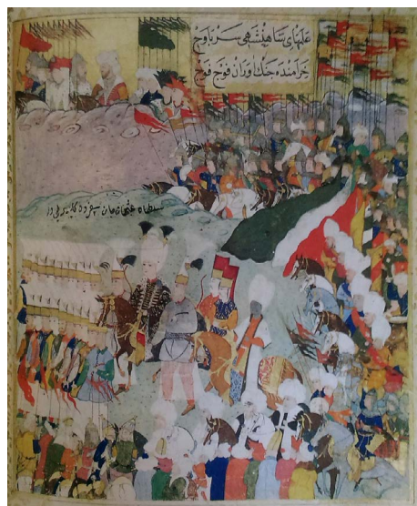
تصویر ۲. رژه لشکر عثمانی در اردوگاه هوتین، شاهنامه نادری یا نبرد هوتین اثر نادری، موزه توپقاپو (H 1124, fol.53b)، ۱۶۲۲ م. نگاره منسوب به احمد نقشی (Atasoy & Gagma, 1974: 69).

با نام شاهنامه نادری ۱۰ یا نبرد هوتین ۱۱ (توپقاپو، H.1124) شناخته می‌شود (تصویر ۲). این کتاب وقایعی را که در زمان سلطنت عثمان دوم اتفاق می‌افتد توصیف می‌کند و ۲۰ نگاره این اثر بایستی تلاش مشترک نقاشان اصلی دربار باشد که دو سبک متمایز را نمایش می‌دهد (Atasoy & Gagma, 1974: 69).