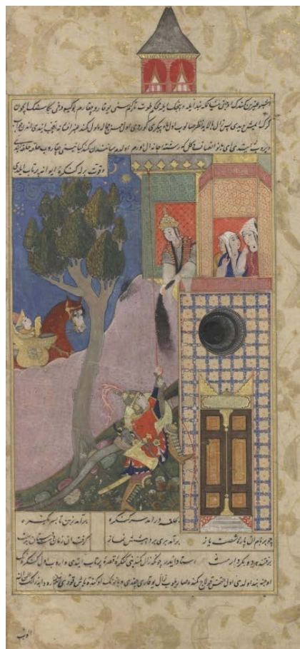
تصویر ۳. «۵۳- ر» داستان زال و رودابه (برگرفته از: کتاب مینیاتور ۲۹ یا مدحی).

کادر پایین: بحلقه درامد سرکنکره / برآمد زین تا بسر یکسره چو بریام آن پاره شصت یاز / برآمد بری برد پیشش نماز گرفت ان زمان دست دستان بدست / برفتند هر دو بکردار مست استادایدر چونکه زال کمندی کنکره قصره پرتاب ایتدی واروب اول کنکره نک اوجنه بند اولدی اول التمس قولاچ کمنده صاریلوب زال یوقاری چقدی و بانونک اوکنده باش قودی انن رودابه زالک الن انه (تصویر ۳).