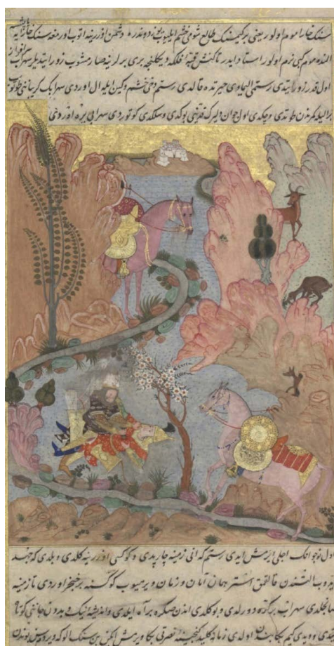
تصویر ۵. نگاره «۱۳۳- چ» رستم سهراب را زخمی می‌کند.

بیچید زان پس یکی آه کرد / ز نیک و بد اندیشه کوتاه کرد بدو گفت کین بر من از من رسید / زمانه بدست تو دادم کلید تو زین بی‌گناهی که این کوژپشت / مرا برکشید و بزودی بکشت