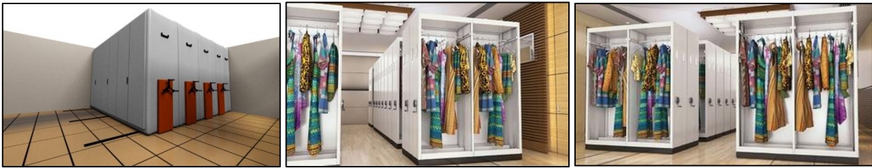
شکل ۳: نمونه‌هایی از سیستم نگاه‌داری متحرک ریلی