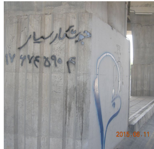
شکل ۴. اجرای پوشش مقاوم سیمانی ضد آب بر روی سطح بتنی عمودی، تصویر سمت راست قبل از اجرا و تصویر سمت چپ بعد از اجرا Figure 4. Application of Water-Resistant Cement Plaster on a vertical concrete surface (right: before application, left: after application)