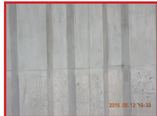
شکل ۳. اجرای پوشش مقاوم سیمانی ضدآب بر روی سطح بتنی (محدوده کادر قرمز رنگ تصویر سمت چپ) بزرگ نمای مرز بین پوشش مقاوم سیمانی ضدآب و سطح بتن طبیعی (تصویر سمت راست)

Figure 3. Application of the waterproof cementitious coating on the concrete substrate. The red rectangle in the left image indicates the treated area. The right image provides a detailed close-up of the interface between the applied coating and the original, uncoated concrete surface