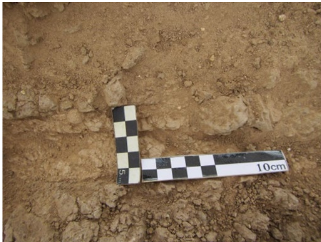
شکل ۷. نمونه ملات میان خشت‌ها، کارگاه ۲۰ Figure 7. Mortar sample between mudbricks, Trench 20