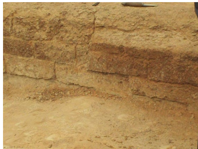
شکل ۶. نمونه خشت از دیواره کارگاه ۲۰ Figure 6. Mudbrick sample from the wall of Trench 20

جدول ۱. نمونه خشت NIB و بافت‌های درون خشت مربوط به دوره آغاز ایلامی