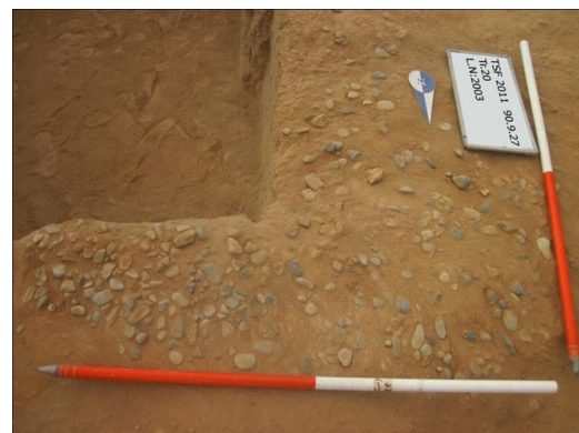
شکل ۳. فضای معماری با کف قلوه‌سنگی

Figure 2. Architectural remains uncovered in Trench 20