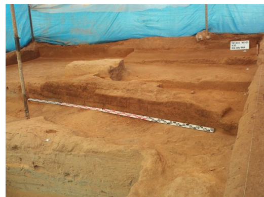
شکل ۴. فضای معماری کارگاه شماره ۲۰

Figure 3. Architectural space featuring a cobblestone floor