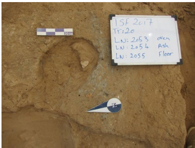
شکل ۸. نمونه دیواره تنور، بستر ۲۰۱۷ الف، کارگاه ۲۰ Figure 8. Sample from the wall of a tannur oven, Context 2017A, Trench 20