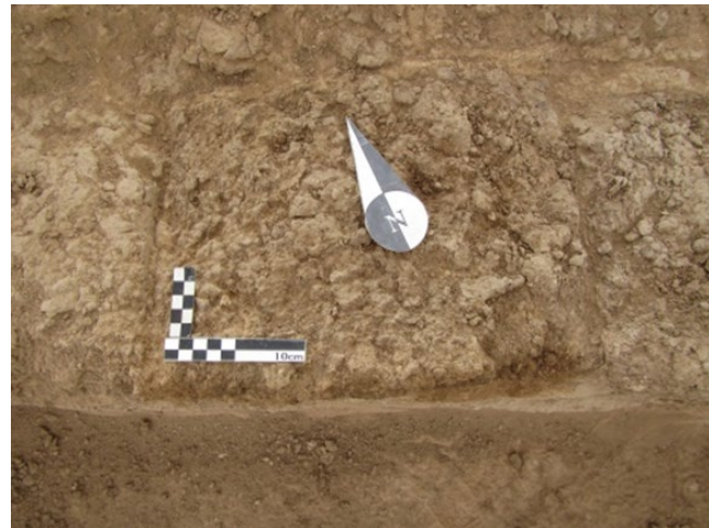
شکل ۵. فضای معماری کارگاه شماره ۲۰ Figure 5. Architectural remains uncovered in Trench 20