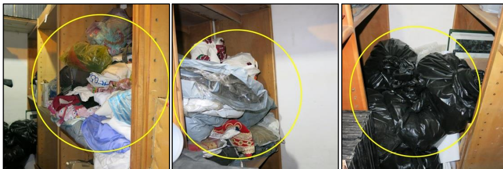
شکل ۲: طرز قرارگیری لباس‌های مردم‌شناسی داخل مخزن