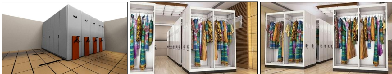
شکل ۳: نمونه‌هایی از سیستم نگاه‌داری متحرک ریلی