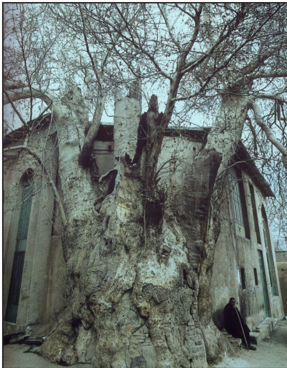
تصویر ۴. مسجد پاچنار وشنوه، دید از شمال (مأخذ: عرب، ۱۳۸۲).