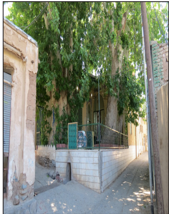
تصویر ۳. نمای بیرونی مسجد پاچنار وشنوه، دید از شمال شرق.