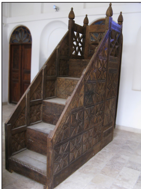
تصویر ۶. نمای سمت چپ منبر.

کتیبه‌های متعددی به خط عربی و فارسی بر چهارچوب و اسکلت اصلی منبر کنده شده‌اند. این کتیبه‌ها به خط ثلث