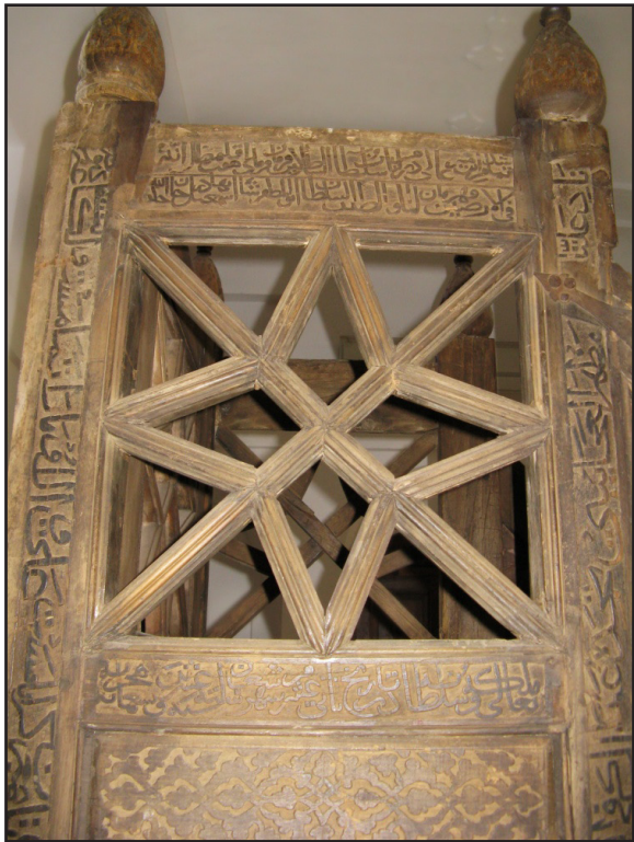
تصویر ۹. جزییات کتیبه‌های چهارچوب فوقانی سمت راست منبر.