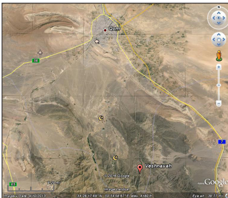
تصویر ۱. تصویر هوایی موقعیت روستای وشنوه در استان قم.

وشنوه از روستاهای تاریخی و کوهستانی بخش کهک قم است که در ۶۴ کیلومتری جنوب این شهر قرار دارد (تصاویر ۱ و ۲). منطقه وشنوه علاوه بر محوطه‌های دوران تاریخی (از جمله معادن باستانی از دوران پارت و ساسانی) دارای محوطه‌ها و بناهای دیگری از دوران اسلامی است. مسجد پاچنار و امامزاده هادی (در میان بافت روستای وشنوه) از جمله این بناها هستند که به دوره صفوی و پیش از آن تعلق دارند. بنای کنونی مسجد جامع پاچنار وشنوه نوساز است (تصاویر ۳ و ۴) (نقشه ۱) اما دارای منبر چوبی منبت‌کاری‌شده‌ای است که این نوشته به معرفی آن پرداخته است. ۱