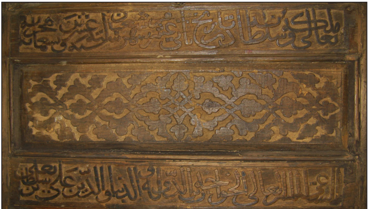
تصویر ۱۰. قاب‌بندی کتیبه مشتمل بر نام بانی و تاریخ ساخت.