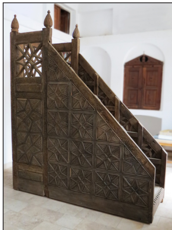
تصویر ۵. نمای سمت راست منبر.