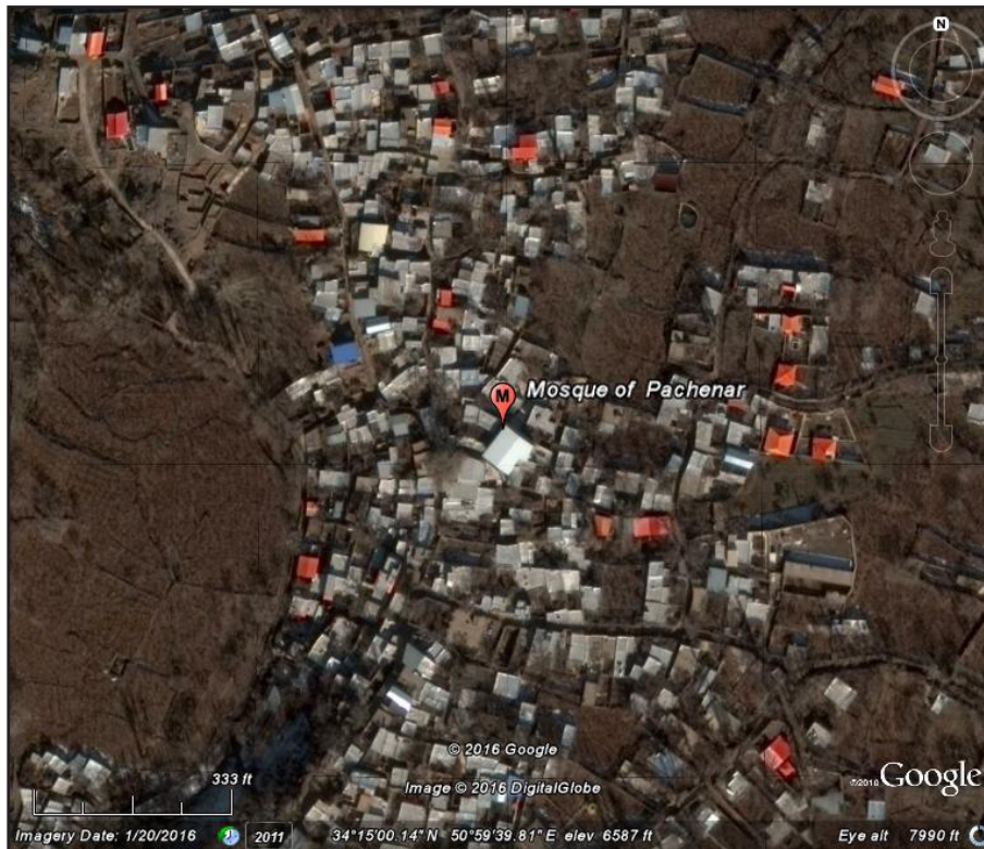
تصویر ۲. موقعیت مسجد پاچنار وشنوه در بافت روستای وشنوه.