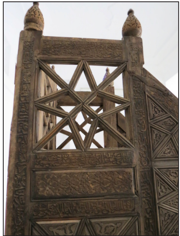
تصویر ۸. کتیبه‌های بخش فوقانی سمت راست منبر مشتمل بر دعای نادعلی، شعائر مذهبی و تاریخ ساخت.