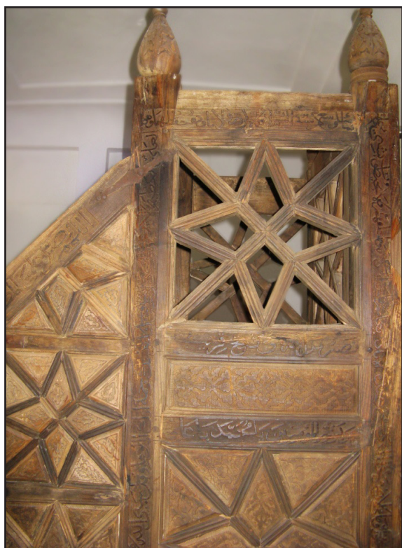
تصویر ۷. کتیبه‌های بخش فوقانی سمت چپ منبر مشتمل بر آیه‌الکرسی و ادعیه قرآنی (عکس از: نگارنده).

ج. کتیبه‌های دیگری با مضامین استغاثه و مدح و ثنا بر چهارچوب اصلی سمت راست منبر رو به پایین آغاز شده و با چرخش نود درجه و طی کردن کلاف عرضی رو به بالا امتداد یافته است و مشتمل بر دعای ناد علی، تواسیح، و شعارهای مذهبی به شرح زیر است: «ناد علیا مظهر العجائبی العجائب» * تجده عونا لك فی النوائبی [النوائب] کل هم و غم سینجلی * بولایتک یا علی یا علی یا علی یا علی». و در ادامه: «علی حبه جنه قسیم النار و الجنة وصی المصطفی حقا امام الانس و الجنة». و در ادامه: «ز مشرق تا به مغرب گر امام است/ علی [و] آل او ما را تمامست الکاتب کیومرث» ۲ (تصاویر ۷ و ۸).