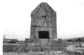
عکس پشت جلد: بنای گوردختر