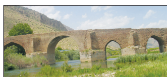
عکس پشت جلد: