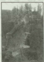
عکس پشت جلد: قلعه رودخان