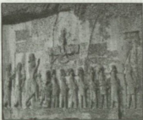
عکس روی جلد: نقش برجسته بیستون

- نظر نویسندگان الزاماً نظر مجله اثر نیست.