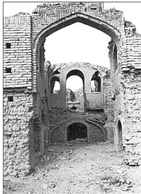
بقعه چهل خاتون - نجم آباد

این روستا در ۱۱ کیلومتری شمال غربی شهرستان فیروزکوه قرار گرفته است. بنای امامزاده دارای نقشه شش ضلعی و گنبدی مخروطی (رک) است. بنا در دو مرحله ساخته شده. بدنه قدیمی شامل برج سنگی ۶ ضلعی با گنبدی مخروط (رک) می‌باشد. این بنا با مصالح سنگ لاشه و ملاط گچ و ساروج ساخته شده و بر روی هر یک از اضلاع شش گانه داخل برج طاق نماها و