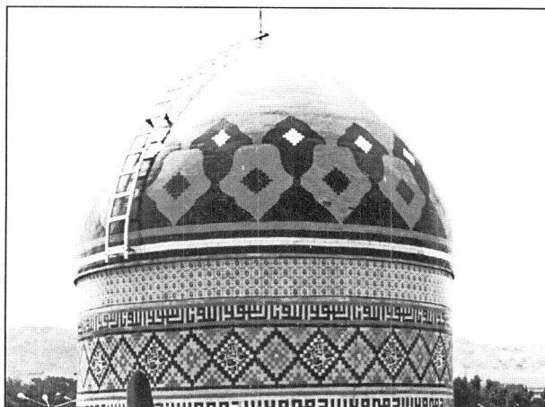
گنبد امامزاده ام‌کبری و ام‌صغری - اشتهارد

روستای نجم آباد از دهستان اکراد بخش نظرآباد و ۲۷ کیلومتری جنوب غربی شهر هشتگرد واقع شده است و بنای متروکه بقعه مزبور به فاصله سه کیلومتری جنوب شرقی روستا