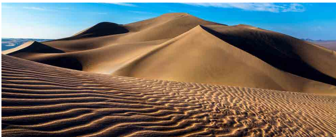
شکل ۳: کویر لوت در سال ۱۳۹۵ ه.ش. به عنوان اولین اثر طبیعی کشور در فهرست میراث جهانی به ثبت رسید- (منبع: ناصر میزبان (URL 6)).

در حوزه میراث طبیعی، طبق آیین‌نامه اجرایی تبصره ماده ۲ قانون تشکیل سازمان میراث فرهنگی سال ۱۳۸۴ ه.ش.، هماهنگی میان سازمان میراث فرهنگی، محیط‌زیست و سازمان جنگل‌ها تعریف شد. از سال ۱۳۸۵ ه.ش.، جلسات مشورتی میان این نهادها آغاز شد که بعدها به تشکیل «شورای راهبری میراث طبیعی جهانی» در زمان تهیه پرونده جنگل‌های هیرکانی انجامید (قمی‌اویلی، ۱۴۰۱). این شورا مسئول بررسی آثار برای فهرست موقت و پیشنهاد نهایی ثبت بود و تصمیمات آن با مشارکت دفتر ثبت آثار طبیعی و تأیید شورای سیاست‌گذاری نهایی می‌شد. نتیجه این همکاری، ثبت نخستین اثر طبیعی ایران (بیابان لوت) و پس از آن جنگل‌های هیرکانی در ۱۳۹۸ ه.ش. بود.