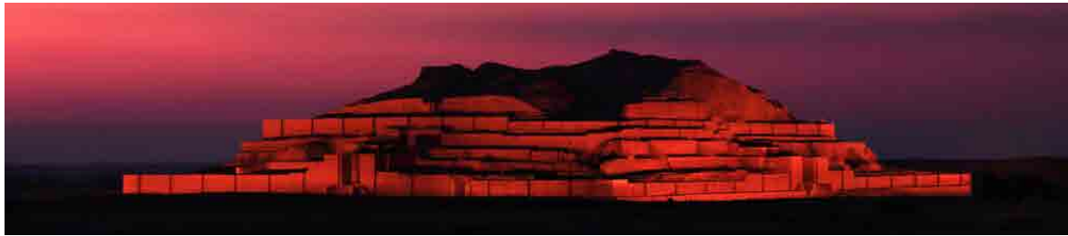
شکل ۱: چغازنبیل به عنوان یکی از سه اثر نخست ثبت شده ایران در فهرست میراث جهانی (منبع: سروش انگبینی)، (URL 6). Fig. 1: Tchogha Zanbil as One of the First Three Iranian Properties Inscribed on the World Heritage List (Soroush Angabini), (URL 6).

نشست کمیته میراث جهانی در مصر (۱۳۵۸)، تنها شه‌ریار عدل با هزینه شخصی موفق به حضور شد (عدل، ۱۳۸۶) و در نتیجه، سه اثر نخست ایران شامل تخت جمشید، چغازنبیل و میدان نقش جهان در فهرست میراث جهانی به ثبت رسیدند.