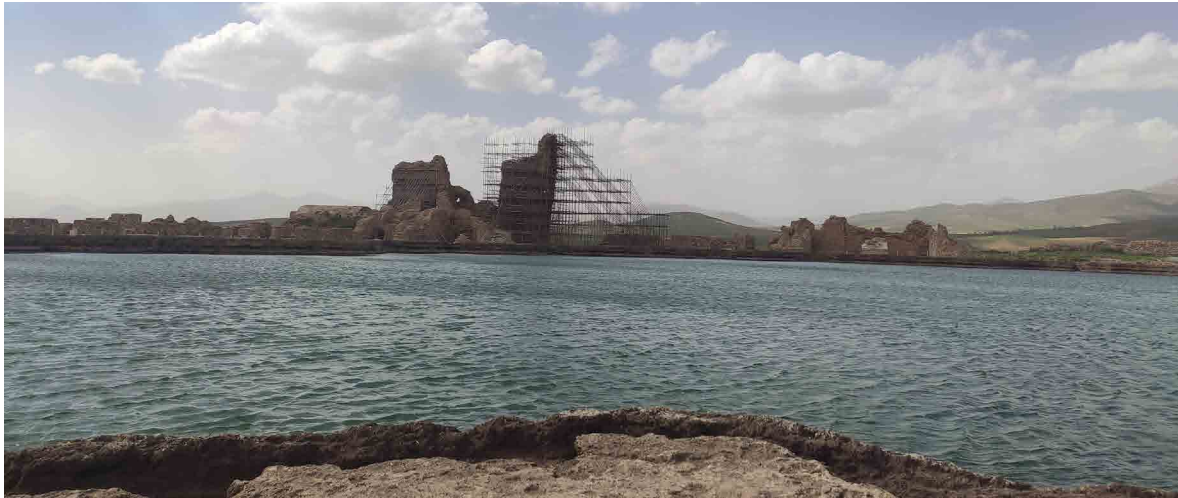
شکل ۲: مجموعه تخت سلیمان اثری که بعد از ۲۴ سال توقف ثبت جهانی در ایران در سال ۱۳۸۲ ه.ش. به ثبت رسید (نگارندگان، ۱۴۰۴).

Fig. 2: Takht-e Soleyman Complex, the Property Inscribed on the World Heritage List in 2003 Following a 24-Year Hiatus in World Heritage Inscriptions in Iran (Authors, 2025).