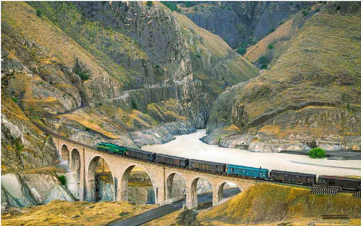
شکل ۴: راه‌آهن سراسری ایران در سال ۱۴۰۰ ه.ش. به‌عنوان اولین اثر میراث صنعتی-مدرن کشور در فهرست میراث جهانی به ثبت رسید (منبع: حسین جوادی (URL 6)).

تا سال ۱۳۹۸ ه.ش.، شورای سیاست‌گذاری ثبت و حریم کشور مسئولیت انتخاب نهایی آثار و تدوین سیاست‌های ثبت جهانی را بر عهده داشت، اما با انحلال آن، این وظایف به شورای ملی ثبت منتقل شد که برخلاف شورای پیشین، تنوع تخصصی کم‌تری داشت (پورعلی، ۱۴۰۱). حذف کارشناسان با سابقه از این شورا باعث کاهش جامعیت تصمیم‌گیری‌ها و تغییر رویکرد در انتخاب آثار شد. به‌عنوان نمونه، سیاست پرونده‌های زنجیره‌ای کنار گذاشته شد و آثاری مانند ماسوله و هگمتانه در سال ۱۴۰۰ ه.ش. بدون این سیاست انتخاب شدند. در این دوره، نگرش به میراث فرهنگی دگرگون شد و مفاهیمی چون میراث صنعتی، مدرن و منظر فرهنگی از اوایل دهه ۸۰؟ وارد فضای دانشگاهی و آموزش عالی شد (حناچی، ۱۴۰۱). این مباحث، از سطح نظری به اقدامات اجرایی راه یافتند. با عضویت ایران در نهادهای بین‌المللی مانند دوکومومو ۱۵ و TICCIH ۱۶ ، فعالیت‌های مرتبط با میراث صنعتی و مدرن رسمیت یافت و منجر به بازنگری فهرست موقت و ثبت راه‌آهن سراسری ایران در سال ۱۴۰۰ ه.ش. به‌عنوان نخستین اثر صنعتی-مدرن کشور شد. این ثبت، پاسخی به درخواست کمیته میراث جهانی برای رفع شکاف‌های موجود در فهرست جهانی و تحقق اولویت‌های آن محسوب می‌شد ۱۷ .