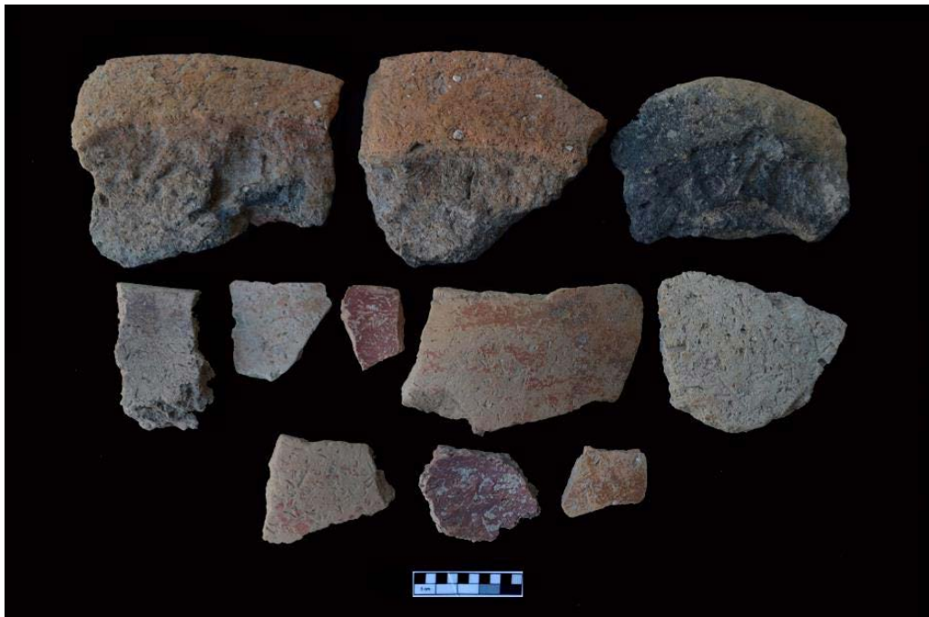
تصویر ۷. سفال‌های نوسنگی جدید؟ تپه قاله زیوا (نگارندگان).