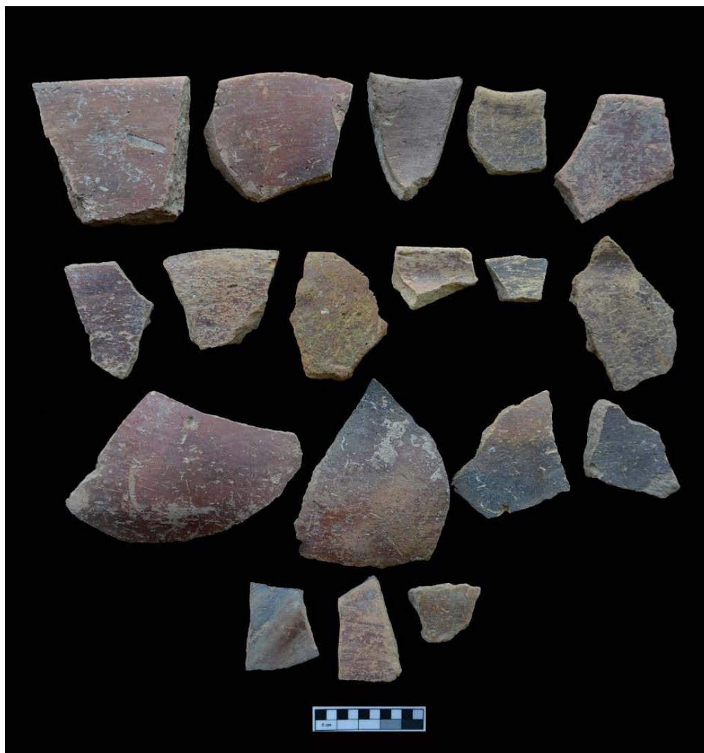
تصویر ۶. سفال‌های جی از تپه قاله زیوا (نگارندگان).

گونه سه‌گابی و B.O.B است. بنابراین آن‌گونه که از شواهد سفالی مشخص است، تپه قاله زیوا از جمله محدود تپه‌های پیش‌ازتاریخ نه‌تنها مریوان، بلکه کل منطقه است که شواهد هر سه دوره نوسنگی جدید؟، مس‌سنگی قدیم و مرحله ابتدایی مس‌سنگی میانی را داراست و لایه‌نگاری آن می‌تواند بسیاری از ابهامات گاه‌نگاری اواخر نوسنگی و اوایل مس‌سنگی منطقه را پاسخگو باشد.