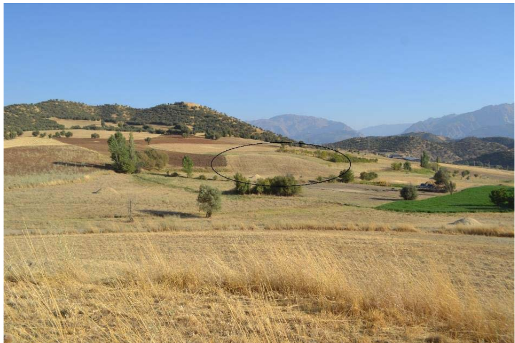
تصاویر ۴ و ۵. دورنمای تپه (نگارندگان).

سفال‌های نوع سراب جدید نیز از بررسی تپه به دست آمدند (تصویر ۷). پوشش‌های گلی براق سطح این چند قطعه بسیار شبیه به پوشش سفال‌های گونه سراب جدید منطقه زاگرس مرکزی و از جمله خود تپه سراب کرمانشاه بوده، ولی به دست نیامدن دیگر گونه‌های شاخص سفالی دوره نوسنگی جدید نظیر سفال‌های منقوش این دوره نظیر سفال خطی سراب باعث می‌شود که در انتساب این گونه سفالی به دوره نوسنگی جدید با شک و تردید مواجه شویم و با آن قاطعیتی که از وجود سفال نوع جی در این تپه سخن به میان آورده‌ایم، سخن نگوییم. به هر حال با توجه به قرابت زمانی تقریباً نزدیک به هم سفال جی با سفال گونه سراب جدید (نیمه دوم هزاره ششم ق.م.) وجود دوره نوسنگی جدید در این تپه نیز زیاد دور از ذهن نمی‌تواند باشد. خوشبختانه شواهد سفالی تپه قاله زیوا تنها محدود به دوره نوسنگی جدید؟ و مس‌سنگی قدیم نیست، بلکه سفال‌های شاخص مرحله ابتدایی دوره مس سنگ میانی (دالما) را نیز دارد (تصویر ۸). آن چه که ما را مطمئن می‌سازد که سفال‌های این مرحله فقط متعلق به مرحله ابتدایی مس‌سنگی میانی است، به دست نیامدن سفال‌های نخودی منقوش مرحله میانی مس‌سنگی میانی نظیر سفال