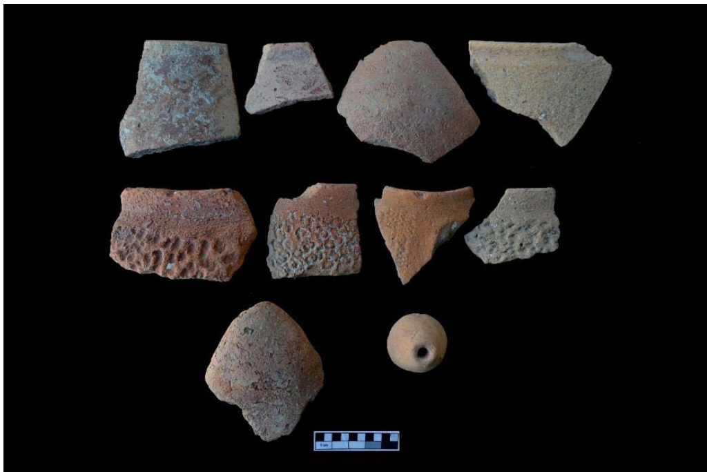
تصویر ۸. سفال‌های دالمایی تپه قاله زیوا (نگارندگان).

و شریفی، ۱۳۹۷ و زارعی و همکاران، ۱۳۹۶). اما در مورد دوره‌های نوسنگی و مس‌سنگی قدیم وضعیت به این‌گونه نیست و محوطه-های کمتری از این دوران گزارش شده‌اند. خوشبختانه گزارش دو محوطه دوره نوسنگی در مریوان و یا کاوش تپه قشلاق بیجار (مترجم و شریفی، ۱۳۹۷) باب جدیدی را در مطالعات دوره نوسنگی منطقه آغاز کرده و نتایج جالبی را نیز به دست داده‌اند.