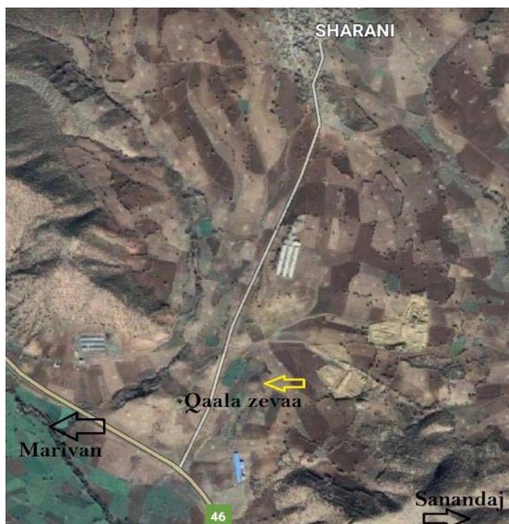
تصویر ۳. موقعیت نسبی تپه قاله زیوا (نگارندگان).

ابعاد و اندازه این تپه حدوداً 70 \times 70 متر و ارتفاع آن از سطح دره جلگه ای دامنه غربی تپه حدوداً ۵ متر است (تصاویر ۴ و ۵) سطح تپه هم‌اکنون کاربری کشاورزی دارد و به گفته مالک این زمین، رأس تپه در گذشته ارتفاع بیش‌تری داشته و جهت تسهیل در امر کشاورزی سطح آن را حدود ۱ متر تسطیح کرده‌اند. همچنین از عمق ۸۰ - سانتی‌متری رأس تپه لوله آبرسانی عبور کرده است. با توجه به این توصیفات و آسیب‌های وارد شده به این اثر ارزشمند می‌توان گفت که وضعیت حفاظتی آن در شرایط نه‌چندان مطلوب قرار دارد و لازم به ذکر است که متأسفانه در فهرست آثار ملی به ثبت نرسیده است.