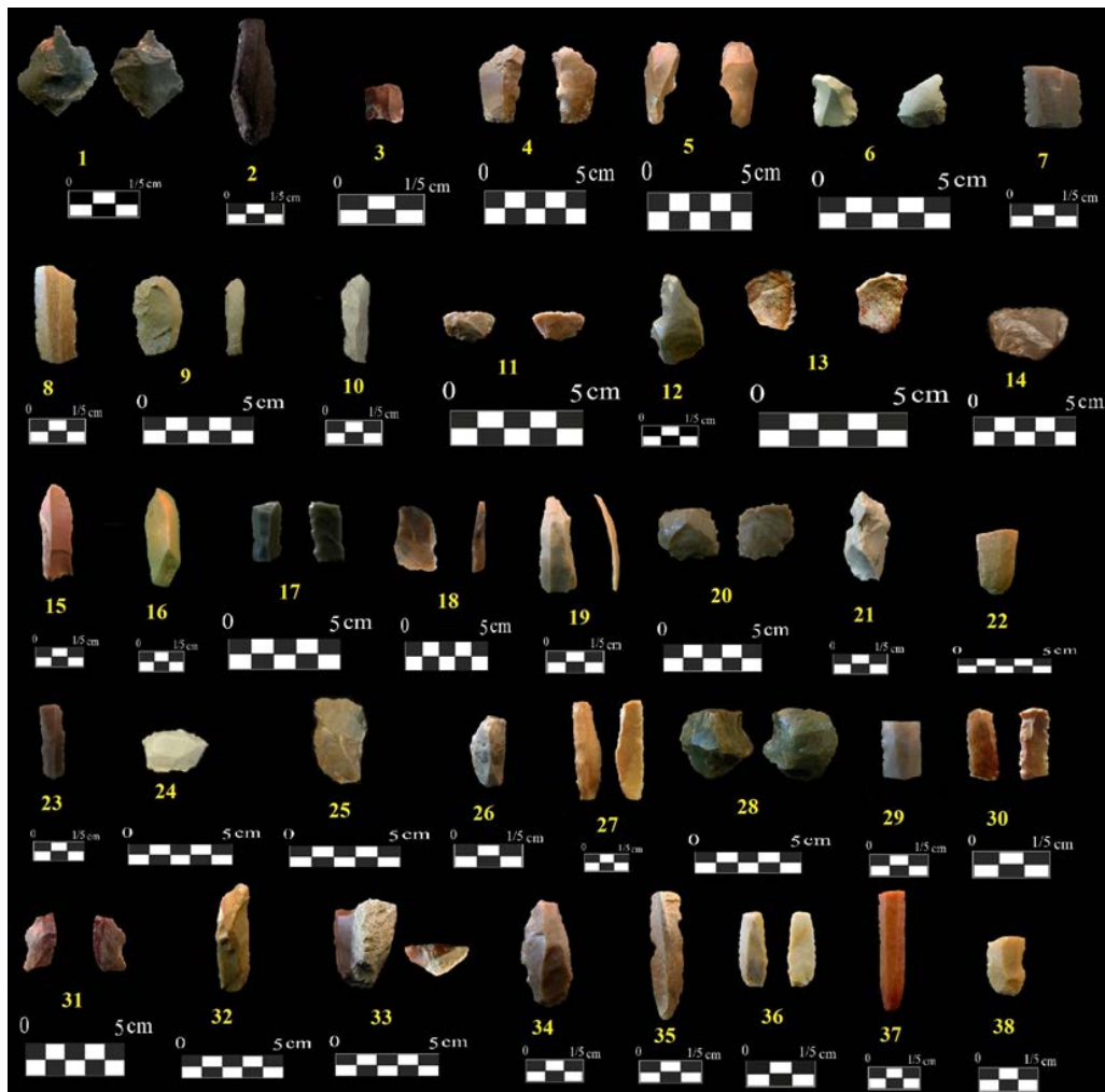
تصویر ۳. نمونه ابزارهای سنگی یافت شده از محوطه‌های پیش از تاریخ دشت کازرون (نگارنده، ۱۳۹۶).

مایل به قرمز، یک قطعه انتهایی proximal تیغه کنگره‌دار از چرت کرم مایل به عسلی، یک قطعه انتهایی proximal تیغه با جلای داس از چرت قهوه‌ای مایل به قرمز، سه قطعه بخش میانی تیغه استفاده شده از چرت حرارت دیده، چرت خاکستری تیره و چرت عسلی (تصویر ۳۸-۳۳). فراوانی قطعات تیغه و وجود آثار جلای داس در برخی قطعات به همراه وجود قطعات کنگره‌دار نشان دهنده محوریت گیاهان در معیشت غذایی مردمان این محوطه است. اما همچون سایر محوطه‌ها هیچ سنگ مادر تیغه/ریزتیغه‌ای در مجموعه این محوطه دیده نمی‌شود. سنگ مادرهای این محوطه به همراه دورریز و تراشه‌های چپ از جنس چرت خاکستری سبز هستند، اما ابزارهای مجموعه تنوع ماده خام بالایی را نشان می‌دهند که عمدتاً شامل چرت در طیف رنگی عسلی و قهوه‌ای به همراه چرت عسلی مایل به قرمز است.