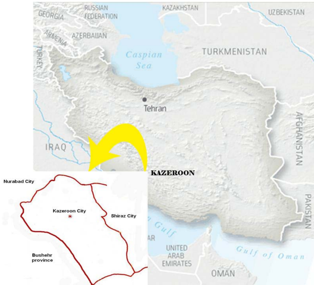
تصویر ۱. موقعیت جغرافیایی شهرستان کازرون (Rezaei, 2012).

جدول ۱. محوطه‌های مورد بررسی دشت کازرون و ساختار فناوریانه ابزارهای سنگی یافت شده (رضایی، ۱۳۹۰: ۲۹۳).