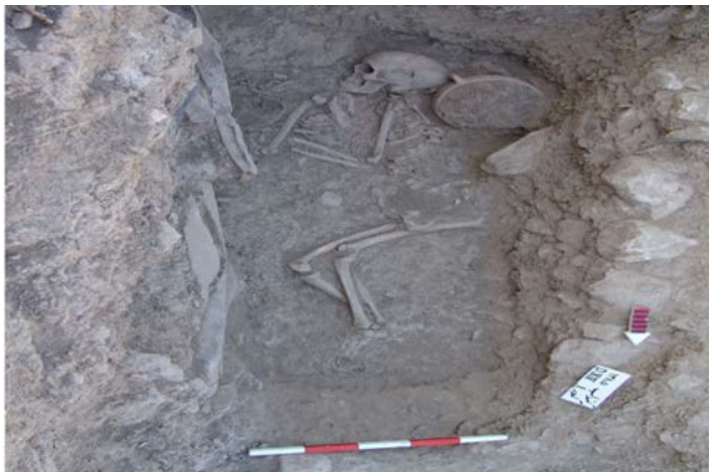
تصویر ۵. نمای تدفین نوع چمباتمه.