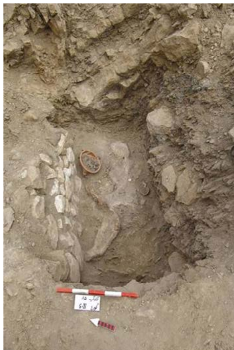
تصویر ۷. نمای گور با معماری يك چينه (نگارنده).

۴- قبور چهارچينه: دیوارهای داخلی این نوع قبور، چه طولی و چه عرضی با قلوه‌سنگ و لاشه‌سنگ به صورت خشکه‌چین بنا می‌شدند. در دیواره این نوع قبور، يك تا چهار طاقچه تعبیه می‌گردید و داخل طاقچه‌ها اشیاء و مواد غذایی قرار می‌گرفت. با رسیدن به پوشش سنگی روی قبور، به تجربه دریافتیم که می‌توان جنسیت اسکلت را تشخیص داد. اقوام ساکن در گندآب