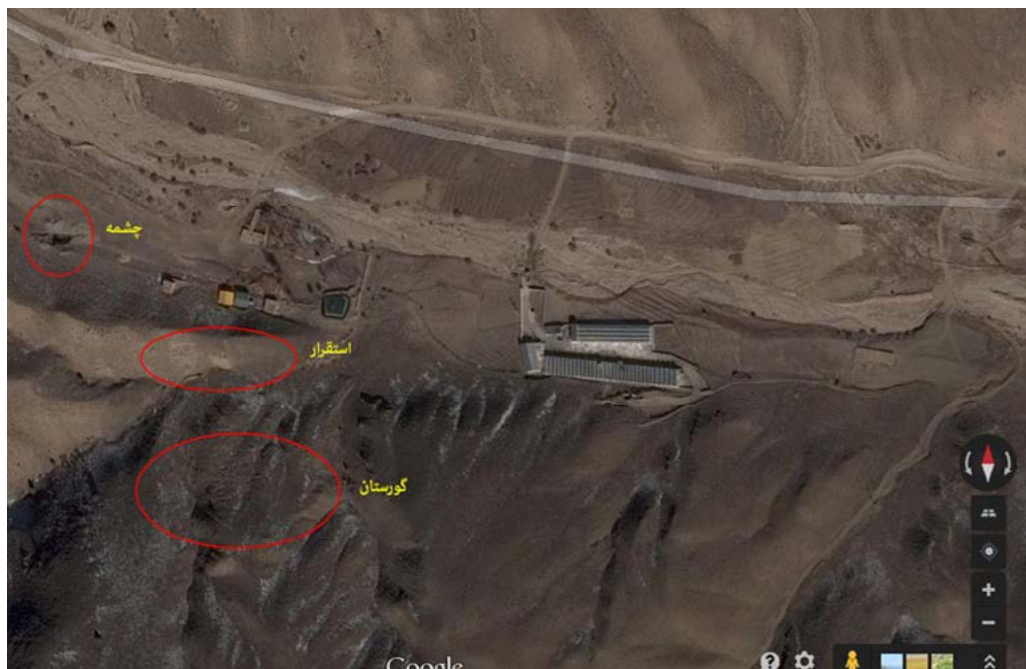
تصویر ۲. تصویر هوایی گندآب از (Google Earth).