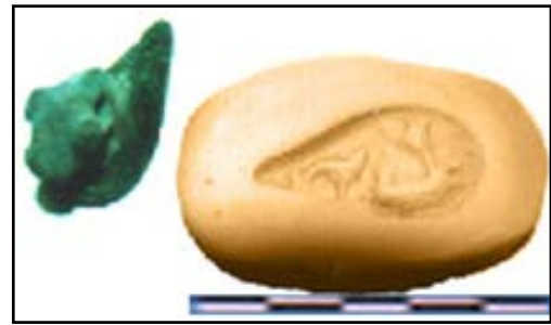
تصویر ۱۴. مهر مفرغی (نگارنده).

موجود در گنجینه ساری با شماره اموالی ۴۷۲۵.