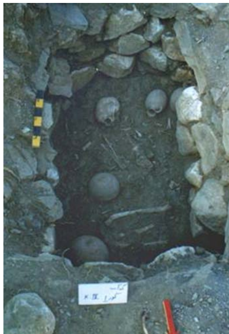
تصویر ۹. نمای گور با معماری چهارچینه (نگارنده).

پوشش روی گورها در گندآب تخته‌سنگ‌هایی است که از معدن سرآور در جنوب گندآب تأمین می‌شده است. بعضی از تخته‌سنگ‌ها به صورت یک پارچه بودند که به مرور زمان در اثر فشار شکسته و به داخل گور فرو ریختند. در بعضی موارد سنگ‌ها با استفاده از تیرهای چوبی بر روی گور قرار می‌گرفتند (تصویر ۱۰). در مواردی نیز دیده شده که درز بین تخته‌سنگ‌ها را با سنگ‌های کوچکتر و ملات گل می‌پوشاندند (تصویر ۱۱) تا خاک به داخل قبر نریزد.