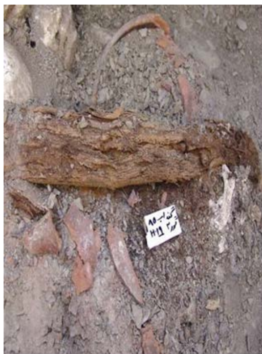
تصویر ۱۱. تخته‌سنگ پوشش روی گور.