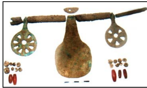
تصویر ۱۵. اشیاء تزیینی.