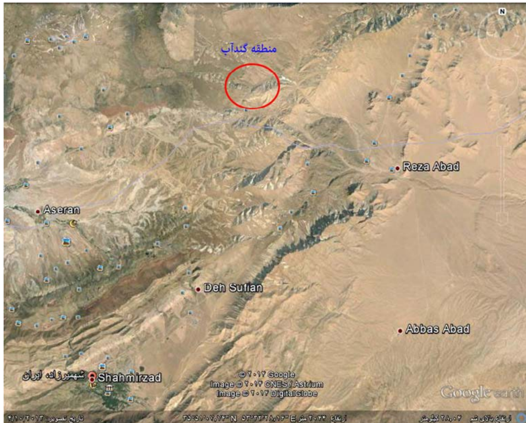
تصویر ۱. تصویر ماهواره‌ای از منطقه.