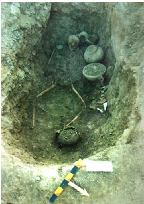
تصویر ۶. نمونه تدفین دست‌کند داخل صخره (نگارنده).