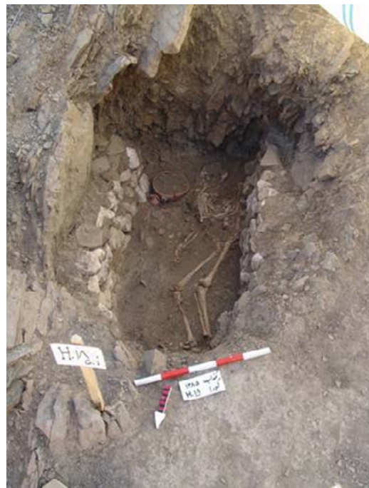
تصویر ۸. نمای گور با معماری دوچینه.