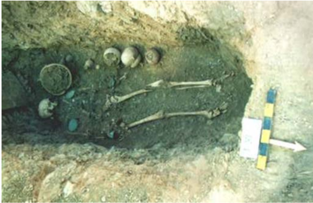
تصویر ۴. نمای تدفین نوع طاق باز (نگارنده).

به‌لحاظ وجود بافت صخره‌ای، گورهای گورستان گندآب به شیوه خاصی حفر می‌شدند. گورها باتوجه به اندازه قد افراد آماده می‌شدند. در مجموع معماری قبور در این گورستان از چهار نوع