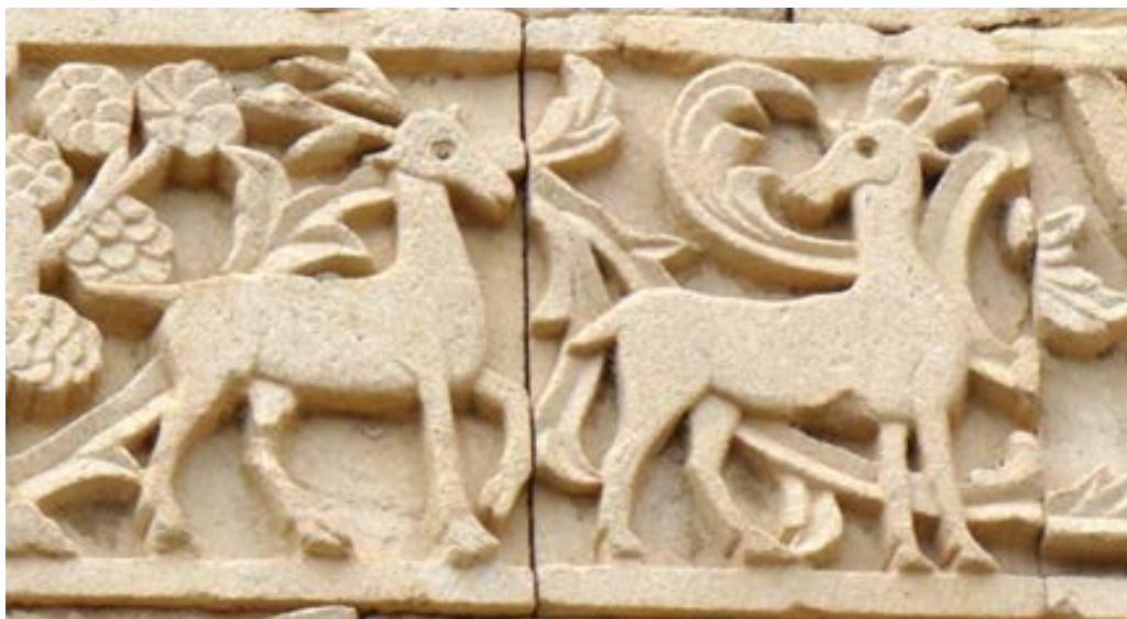
تصویر ۱۰. نقش گوزن در ردیف سوم نگاره‌های قره‌کلیسا (نگارندگان، ۱۳۹۷).

گوزن نر همانند عقاب و شیر، دشمن دنیوی مار است که از جهت نمادین نشانه مطلوبیت اوست و ارتباط نزدیک با نور و آسمان دارد. گوزن را نمادی از تعالی نیز دانسته‌اند. گوزن نماد نیک‌اندیشی است که با شرق، طلوع، نور، پاکی، تولد دوباره، خلاقیت، باروری و معنویت مرتبط است. بخشی از ابهت گوزن به سبب شکل ظاهری، زیبایی، وقار و چابکی آن است. نقش پیام‌آور خدایان را نیز دارد (سرلو، ۱۳۸۸: ۶۶۳-۶۶۲).