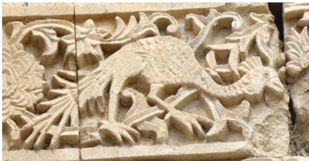
تصویر ۱۳. نقش طاووس بر روی نمای قره‌کلیسا.

طاووس در دوران باستان در آیین زرتشت به عنوان مرغی مقدس مورد توجه بوده است (خزایی، ۱۳۹۰: ۱۳۹). این پرنده در ایران باستان نیز به عنوان مرغ ناهید (آناهیته، ایزد آب) مطرح بوده است (پرهام، ۱۳۷۱: ۵).