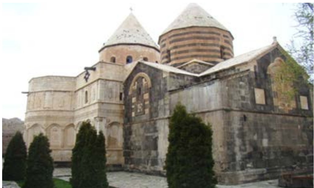
تصویر ۲. نمایی از ضلع شمالی قره‌کلیسا (نگارندگان، ۱۳۹۷).

بیشترین نقوش جانوری قره‌کلیسا در ردیف سوم حجاری شده است. این نقوش همان‌هایی هستند که به‌طور مستقیم انسان به شکار آن‌ها پرداخته و یا به‌نحوی با موضوع شکار و زندگی روزمره شکارچیان در ارتباط بوده و یا ریشه در ادیان گذشته داشته و بیشتر جنبه اعتقادی و باوری دارند. این نگاره‌ها از نظر فراوانی و تعداد به‌ترتیب ذیل قابل تفکیک هستند که در ادامه به معرفی آن‌ها می‌پردازیم.