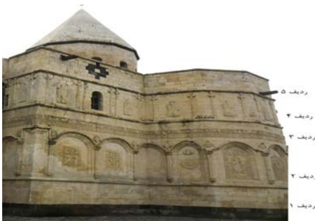
تصویر ۳. نمایی از ضلع جنوبی و ردیف بندی نقوش کلیسای غربی (سفید)، (نگارندگان، ۱۳۹۷).

اژدها: در پایه ستون ناقوس قره کلیسا نقش یک اژدها حجاری شده است. در این نقش یکی از قدسیین معروف به «سن ژرژ» که سوار بر اسب و مسلح به سپر و نیزه است، در حال نبرد با اژدهایی است که زیر پای اسب او قرار گرفته است. در واقع اژدها در این تصویر به عنوان نماد اهریمن و شر ترسیم شده است (تصویر ۴).