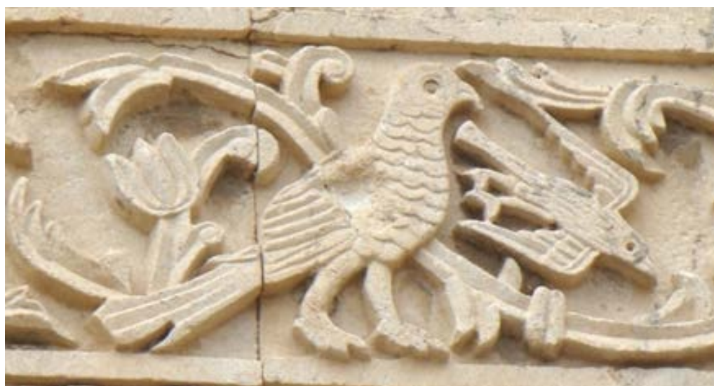
تصویر ۱۵. نقش کبوتر در میان نقوش ردیف دوم قره‌کلیسا (نگارندگان، ۱۳۹۷).

مجسمه‌هایی که از کبوتر و قمری در خوزستان و جاهای دیگر ایران پیدا شده، همگی رمزی از ناهیدند. در انجیل مرقس (باب اول فقره ۱۰) آمد که چون عیسی از آب برآمد، دید که آسمان شکافته شد و روح مانند کبوتر بر وی فرود آمد. در انجیل متی باب سوم فقره ۱۶ نیز آمده که چون عیسی غسل تعمید یافت، فوراً از آب برآمد و آنگاه آسمان بروی گشاده شد و او دید که روح خداوند مانند کبوتر فرو آمد و بر وی درآمد. به همین جهت از کبوتر به عنوان نماد روح القدس و پیک صلح و صفا و نماد عشق و عصمت استفاده می‌شود (یا حقی، ۱۳۸۶: ۶۶۲-۶۶۱).