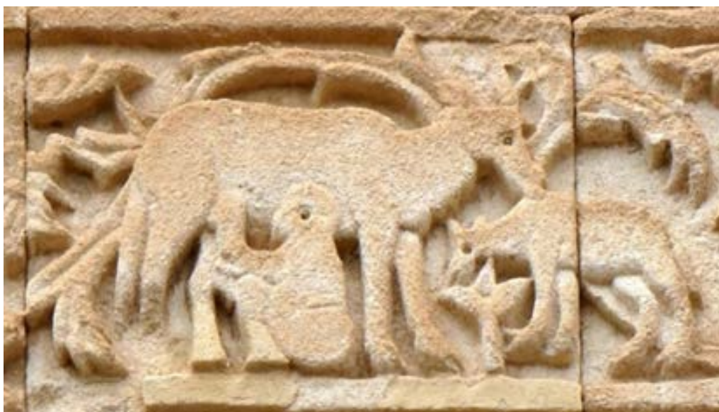
تصویر ۱۱. نقش گاو در ردیف سوم نگاره‌های قره‌کلیسا (نگارندگان، ۱۳۹۷).

نو، مظهر مرگ زمستان و تولید نیروی حیات آفریننده است (کوپر، ۱۳۸۰: ۳۰۱). علاوه بر گاو نر، در بسیاری از ادیان باستانی، ماده‌گاو به عنوان سرچشمه لقاح و آبستنی، پس از ورزا (گاو نر)، مقام دوم را در قدرت زایایی به دست آورده است. از این رو ماده‌گاو را نیز همچون وزرا می‌پرستیده‌اند (وارنر، ۱۳۸۶: ۵۰۹).