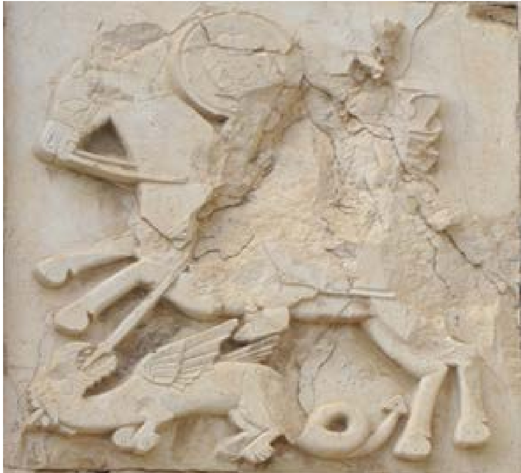
تصویر ۴. نقش ازدها زیر پای فرد سواره (نگارندگان، ۱۳۹۷).

به سبب داشتن بصیرت، اغلب نقش هشداردهنده به موقع به ارباب خود ایفا می‌کند. یونگ اسب را نمادی از مادر درونی و دریافت درونی و اشراقی انسان می‌داند. وی همچنین اسب را هم به نیروهای پست انسان و هم به آب ارتباط می‌دهد (سرلو، ۱۳۸۸: ۱۳۴-۱۳۲).