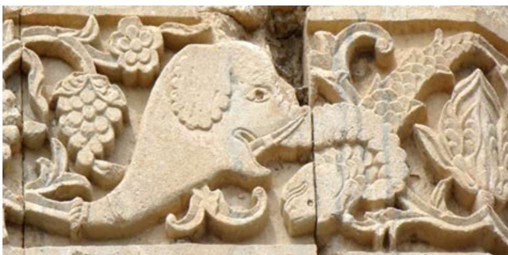
تصویر ۱۲. نقش ماهی در ردیف سوم (بخش بالایی) قره‌کلیسا (نگارندگان، ۱۳۹۷).

ماهی یکی از نشانه‌های مسیحیت در قرون اولیه مسیحیت بود و افراد برای شناسایی هم، مانند رمزی از آن استفاده می‌کردند. این نشانه در قلمرو نمادشناسی مظهر حاصل خیزی و باروری