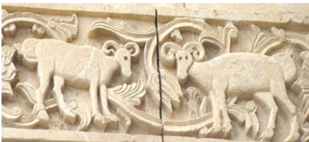
تصویر ۹. نقش قوچ در ردیف سوم (بخش بالایی) قره‌کلیسا (نگارندگان، ۱۳۹۷).

قوچ: در تصویر ۹ در میان نگاره‌های ردیف سوم قره‌کلیسا، نقش دو قوچ ارائه شده است. در این نقش دو قوچ درحالی درمقابل هم قرار گرفته‌اند که یکی از آن‌ها به صورت نیم‌رخ و دیگری تمام‌رخ به صورت ایستاده حجاری شده‌اند. نقش این جانوران به صورت طبیعی نشان داده شده و از روی شاخ‌های پیچیده و دمبه آن‌ها قابل تشخیص هستند.