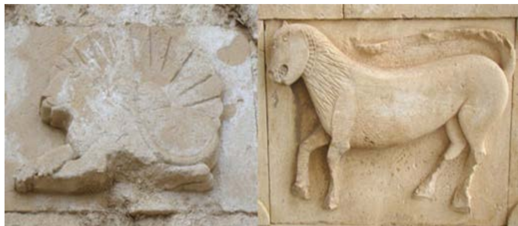
تصویر ۸. نقوش شیرهای حجاری در پایه برج ناقوس و ردیف دوم نمای قره‌کلیسا (نگارندگان، ۱۳۹۷).

شیرها نگهبانان نمادین پرستش‌گاه‌ها و قصرها بوده‌اند. پیدا شدن شیر در هنر مصر، بین‌النهرین و ایران باستان نشان می‌دهد که این حیوان روزگاری در این مناطق می‌زیسته است (هال، ۱۳۸۰: ۶۱). علاوه بر اینکه ایرانیان آن را نشان پنجم از برج‌های آسمانی (اسد) می‌دانسته‌اند، در آیین مهری، شیر با آتش در ارتباط بوده و مراقبت از شعله مقدس آتشدان را برعهده داشته است (هیلنز، ۱۳۸۵: ۱۳۵).