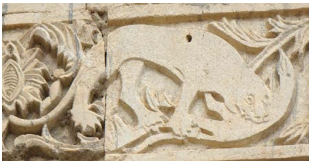
تصویر ۶. نقوش پلنگ در ردیف سوم نمای قره‌کلیسا (نگارندگان، ۱۳۹۷).

نمادپردازی اسب بسیار پیچیده است. الیاده اسب را حیوانی می‌داند که در آئین‌های پرستش همراه آئین‌های خاکسپاری آمده است. اسب را نماد باستانی حرکت چرخشی جهان و پدیده‌ها نیز می‌دانند. همچنین اسب را نماد آرزوهای شدید و غرایز و نیز وسیله‌ای برای سواری دانسته‌اند. در میان مردم باستان رودزیا، هر سال برای خورشید اسب قربانی می‌کردند. اسب را به مارس نیز هدیه می‌کردند و ظهور ناگهانی یک اسب را نشانه جنگ می‌دانستند (اخوان‌ا قدم، ۱۳۹۳: ۴۱). در هنر مسیحیت، اسب را نماد سرقدیس، آناستازیوس، هیبولیتوس و کیرینوس دانسته‌اند (اسماعیل پور، ۱۳۸۶: ۵۱۸).