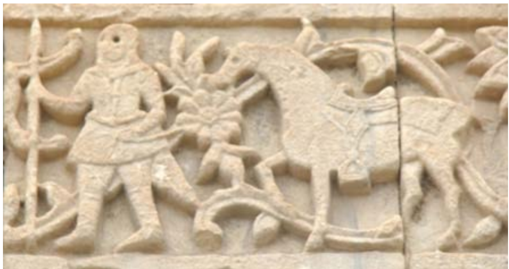
تصویر ۵. نقش اسب در ردیف سوم قره‌کلیسا (نگارندگان، ۱۳۹۷).

به سبب داشتن بصیرت، اغلب نقش هشداردهنده به موقع به ارباب خود ایفا می‌کند. یونگ اسب را نمادی از مادر درونی و دریافت درونی و اشراقی انسان می‌داند. وی همچنین اسب را هم به نیروهای پست انسان و هم به آب ارتباط می‌دهد (سرلو، ۱۳۸۸: ۱۳۴-۱۳۲).