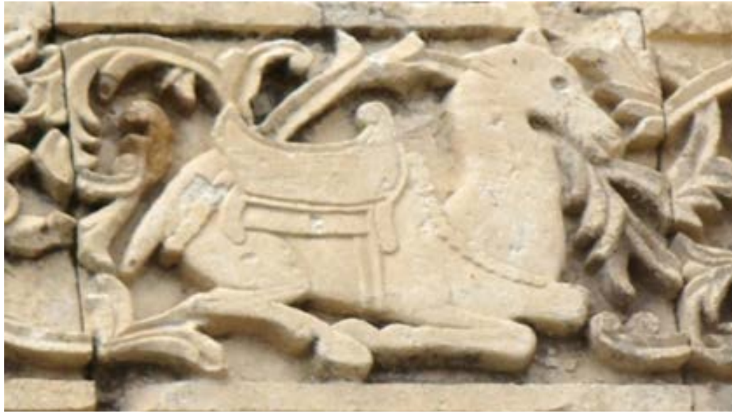
تصویر ۷. نقش شتر در ردیف سوم (بخش بالایی) قره‌کلیسا (نگارندگان، ۱۳۹۷).

شیر: در پایه‌های برج ناقوس قره‌کلیسا، دو شیر نقش شده یکی از شیرها به صورت ایستاده با دم برگشته به پشت، در حال حرکت بوده و دیگری نقش شیر با خورشید را نشان می‌دهد. در این نقش شیر نشسته و دو دست خود را بر روی هم انداخته و بر پشت آن تصویر خورشید ارائه شده است (تصویر ۸).