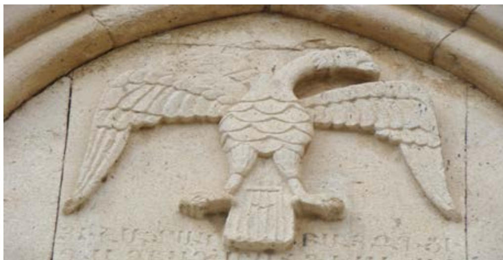
تصویر ۱۴. نقش عقاب بر روی نمای قره‌کلیسا (نگارندگان، ۱۳۹۷).

مجسمه‌هایی که از کبوتر و قمری در خوزستان و جاهای دیگر ایران پیدا شده، همگی رمزی از ناهیدند. در انجیل مرقس (باب اول فقره ۱۰) آمد که چون عیسی از آب برآمد، دید که آسمان شکافته شد و روح مانند کبوتر بر وی فرود آمد. در انجیل متی باب سوم فقره ۱۶ نیز آمده که چون عیسی غسل تعمید یافت، فوراً از آب برآمد و آنگاه آسمان بروی گشاده شد و او دید که روح خداوند مانند کبوتر فرو آمد و بر وی درآمد. به همین جهت از کبوتر به عنوان نماد روح القدس و پیک صلح و صفا و نماد عشق و عصمت استفاده می‌شود (یا حقی، ۱۳۸۶: ۶۶۲-۶۶۱).