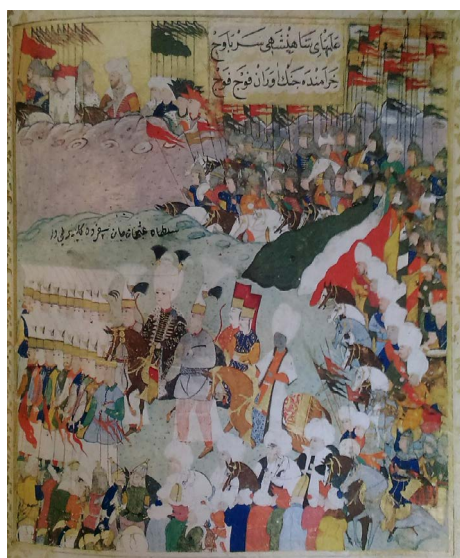
تصویر ۲. رژه لشکر عثمانی در اردوگاه هوتین، شاهنامه نادری یا نبرد هوتین اثر نادری، موزه توپقاپو (H 1124, fol.53b)، ۱۶۲۲ م. نگاره منسوب به احمد نقشی (Atasoy & Gama, 1974: 69).

با نام شاهنامه نادری ۱۰ یا نبرد هوتین ۱۱ (توپقاپو، H.1124) شناخته می‌شود (تصویر ۲). این کتاب وقایعی را که در زمان سلطنت عثمان دوم اتفاق می‌افتد توصیف می‌کند و ۲۰ نگاره این اثر بایستی تلاش مشترک نقاشان اصلی دربار باشد که دو سبک متمایز را نمایش می‌دهد (Atasoy & Gama, 1974: 69).