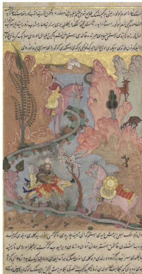
تصویر ۵. نگاره «۱۳۳- چ» رستم سهراب را زخمی می‌کند (برگرفته از: جلد دوم کتاب شاهنامه فردوسی).

بیچید زان پس یکی آه کرد / ز نیک و بد اندیشه کوتاه کرد بدو گفت کین بر من از من رسید / زمانه بدست تو دادم کلید تو زین بی‌گناهی که این کوژپشت / مرا برکشید و بزودی بکشت